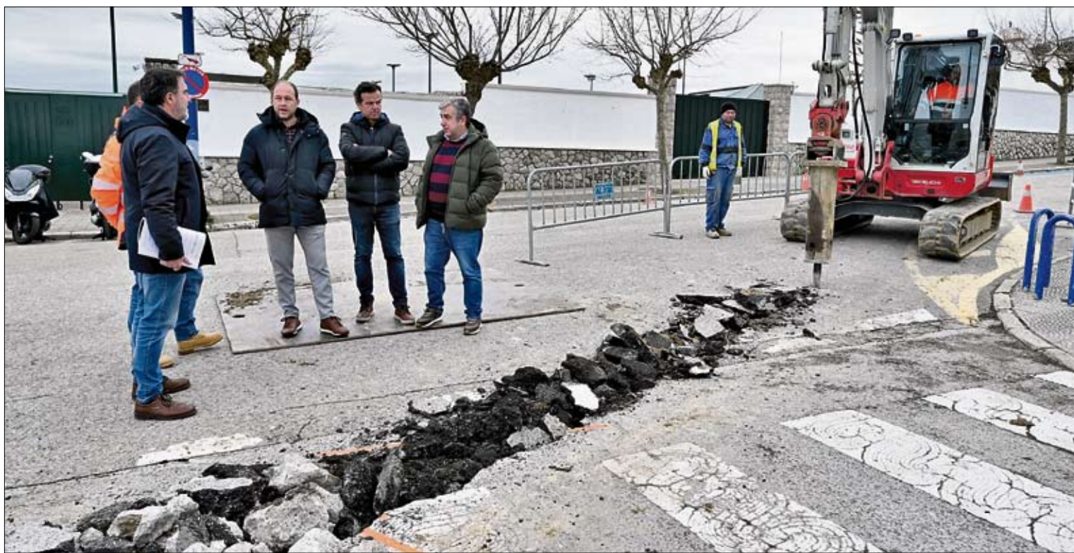
Inicio obras en la Avenida de La Magdalena.