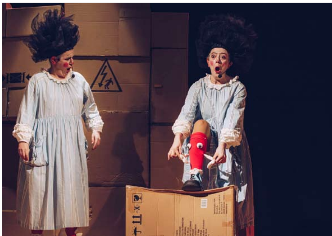
Distintas compañías presentarán propuestas que combinan ironía, experimentación escénica y una marcada mirada femenina sobre la realidad. / CDAT

directo entre ambas series, ofreciendo al visitante la posibilidad de comparar temas, soluciones iconográficas y recursos gráficos.