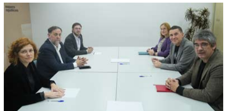
El líder de ERC, Oriol Junqueras (2i), y el secretario general de EH Bildu, Arnaldo Otegi (2d).

COOPERACIÓN POLÍTICA E INSTITUCIONAL. Además de esa relación entre partidos, ERC y EH Bildu coinciden también en el ámbito institucional. En el Congreso de los Diputados ambas formaciones ejercen como socios parlamentarios del Gobierno presidido por Pedro Sánchez, respaldando diversas iniciativas legislativas impulsadas por el Ejecutivo durante la legislatura. La