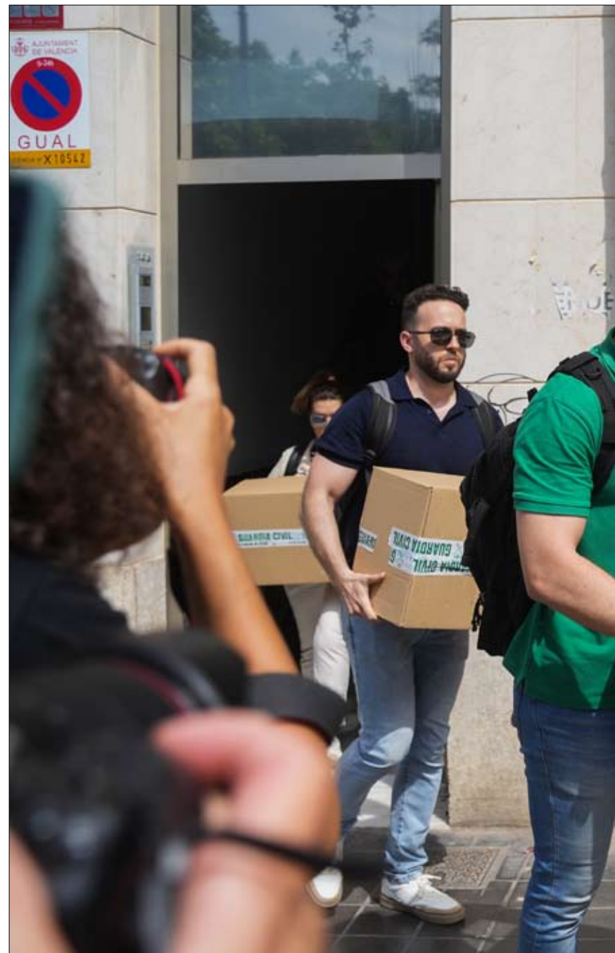
Agentes de la UCO salen de la casa del exministro de Transportes, José Luis Ábalos

El análisis de su actuación forma parte de las diligencias encaminadas a esclarecer cómo se gestionaron