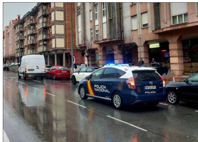
Un coche de la Policía Nacional en El Alisal.

A pesar de la intimidación ejercida con las armas blancas, los autores abandonaron finalmente el establecimiento sin conseguir sustraer ningún botín. Tras la huida de los sospechosos, la Policía Nacional fue