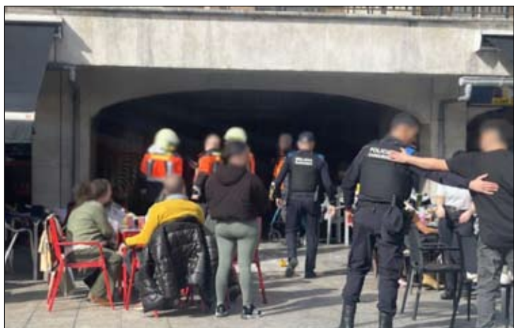
El suceso se saldó sin heridos. / ALERTA

La parte afectada se localiza en el saliente que configura el soportal que cubre el acceso a los establecimientos hosteleros situados bajo la plaza superior.