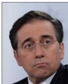
José Manuel Albares Ministra de Exteriores

«Puede que la ronda de contacto del Gobierno por Irán sea otro acto de propaganda»