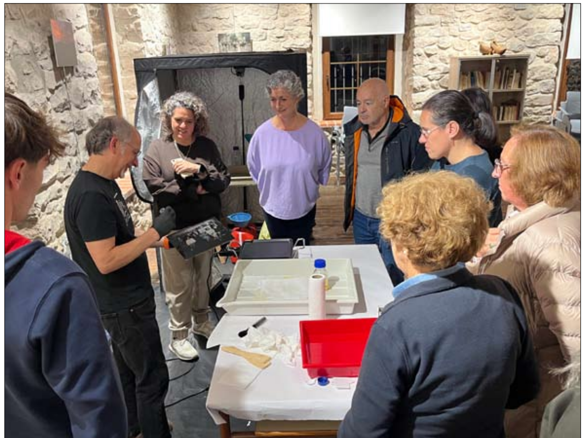
La iniciativa busca poner en valor las fotografías y álbumes conservados en los hogares, considerados un patrimonio documental.

nes de la Fundación PEM, la Fundación Camino Lebaniego y los ayuntamientos del Valle de Villaverde y del Real Valle de Valderredible. También colaboran mediante la cesión de