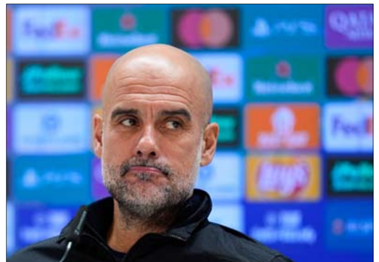
El entrenador del Manchester, Pep Guardiola.

su competitividad histórica. «El Real Madrid siempre es el Real Madrid», recordó, subrayando el respeto que siente por el club madrileño. El entrenador del City también se refirió al duelo con el técnico madridista, con quien coincidirá por primera vez en los banquillos. Reconoció que no mantiene relación personal con él, aunque considera que ambos equipos se conocen bien después de tantos enfrentamientos recientes. Guardiola recordó que en diciembre su equipo ya se impuso a un Real Madrid dirigido por Xabi Alonso, pero espera un partido similar en cuanto a intensidad y exigencia. En su opinión, más allá de las teorías tácticas, la eliminatoria dependerá en gran medida del rendimiento de los jugadores.