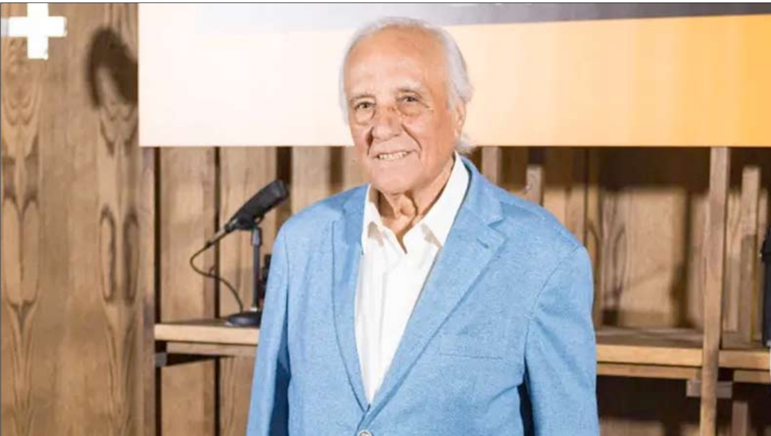
El periodista Raúl del Pozo en una imagen de archivo. /x

Su trayectoria estuvo marcada por la pasión absoluta por el periodismo, y por la búsqueda constante de historias, amaba las corresponsalías, las conversaciones interminables y las madrugadas de trabajo