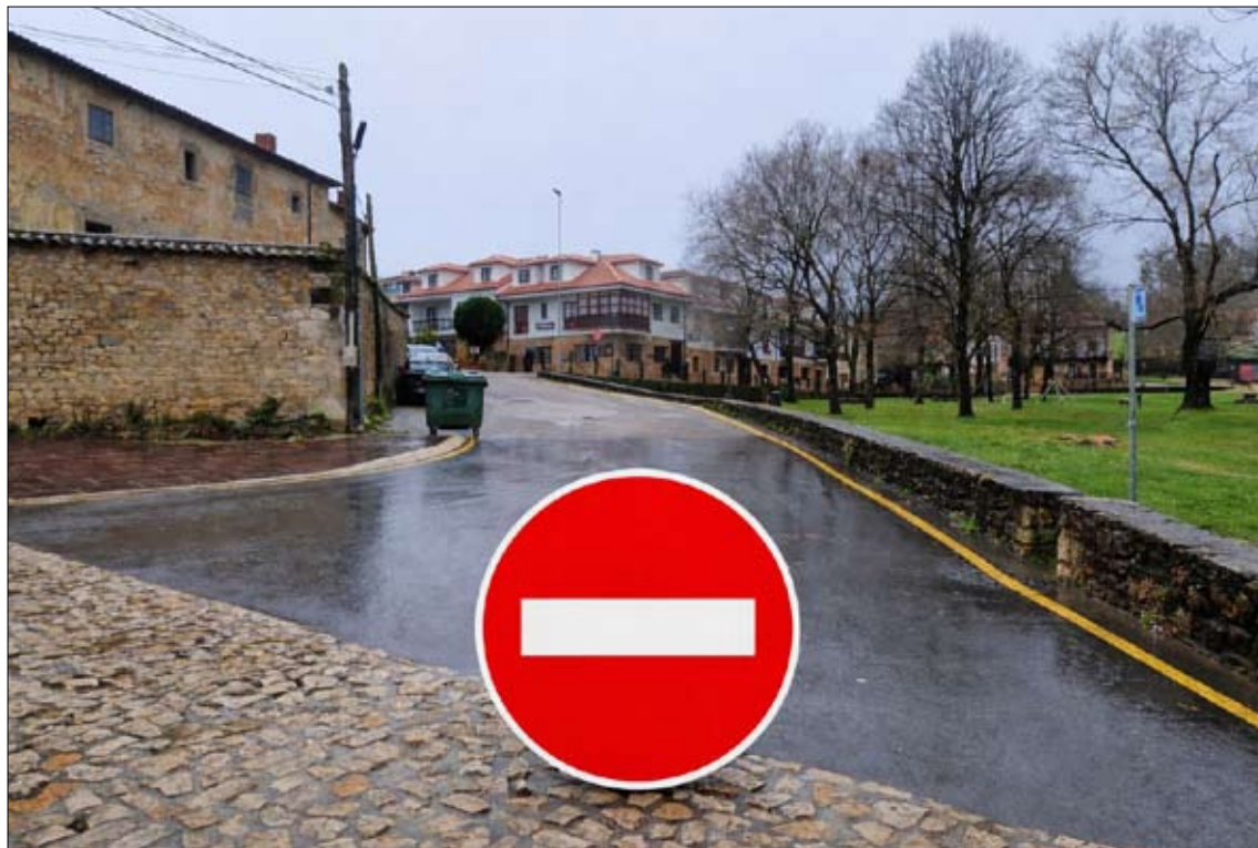
Con la semipeatonalización de La Robleda, Santillana del Mar busca fomentar la movilidad peatonal.

Desde el Ayuntamiento de Santillana del Mar han pedido disculpas anticipadas por las molestias que estas obras puedan ocasionar.