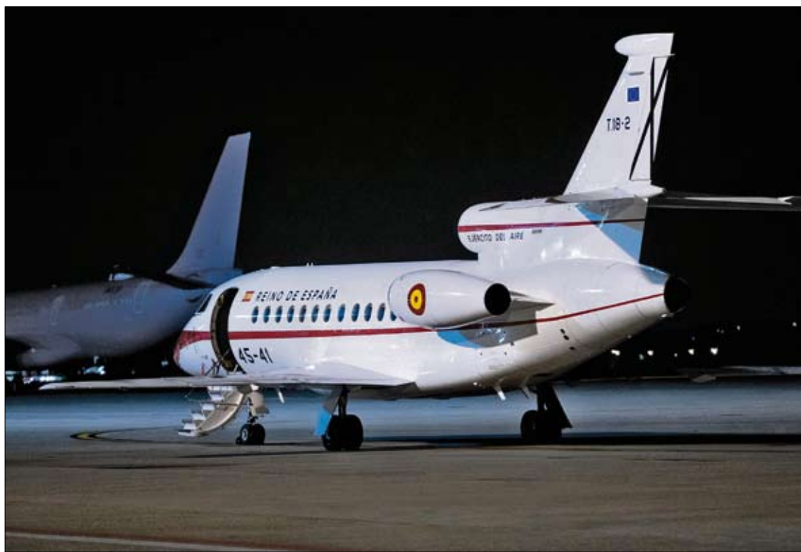
El Falcon 900B en la Base Aérea de Torrejón de Ardoz.