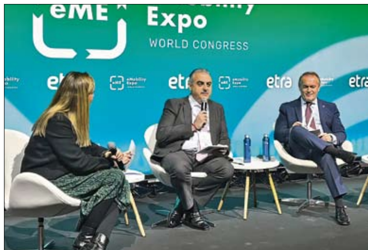
Media defiende mejorar las conexiones con los corredores Atlántico y Mediterráneo. / ALERTA

En este contexto, ha criticado el «desinterés» mostrado por el ministro de Transportes, Óscar Puente, y ha considerado «la gravedad» de que en los últimos dos años y medio no se haya convocado ninguna conferencia sectorial de Transportes.