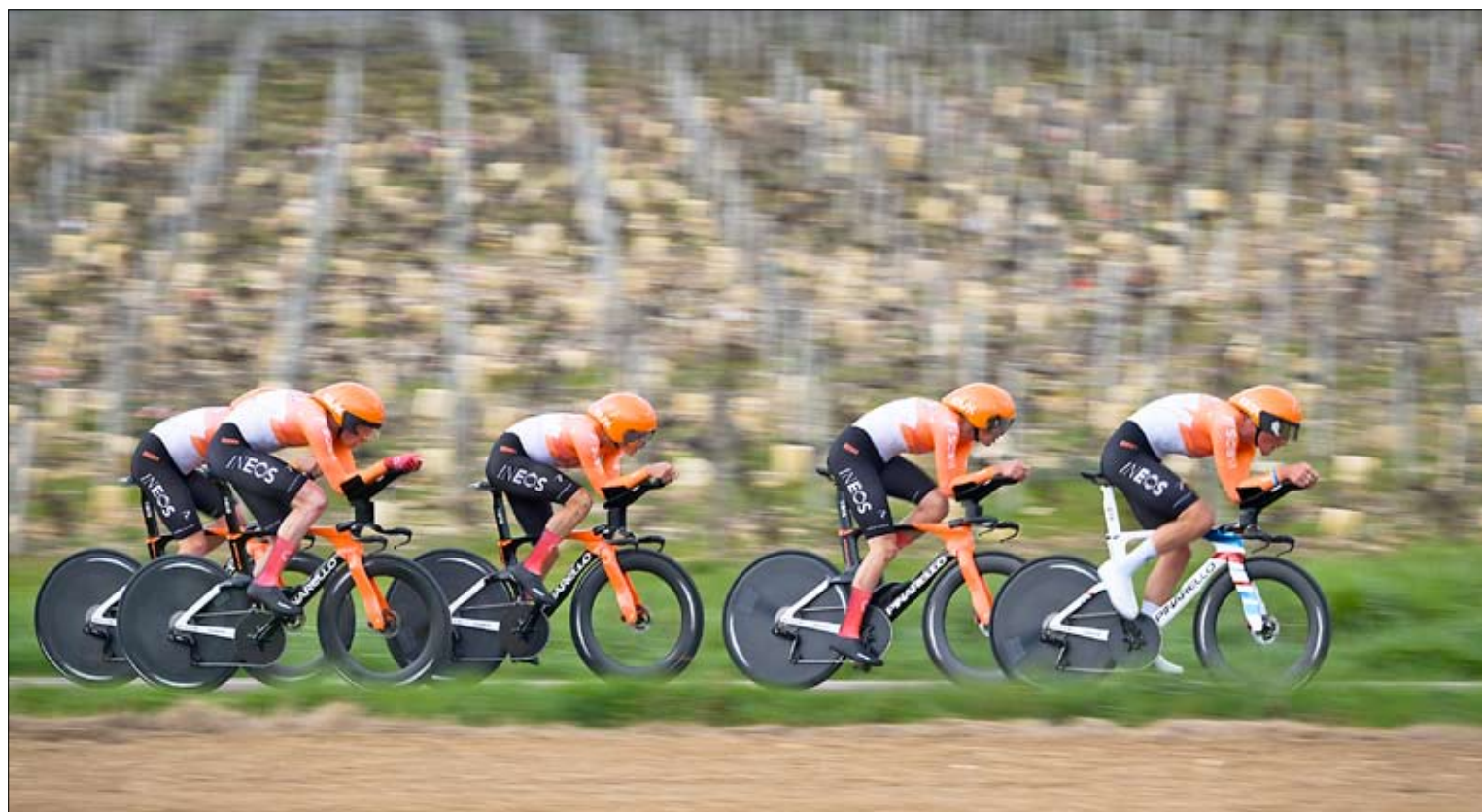
El equipo británico INEOS Grenadiers se lleva la tercera etapa de la París-Niza.