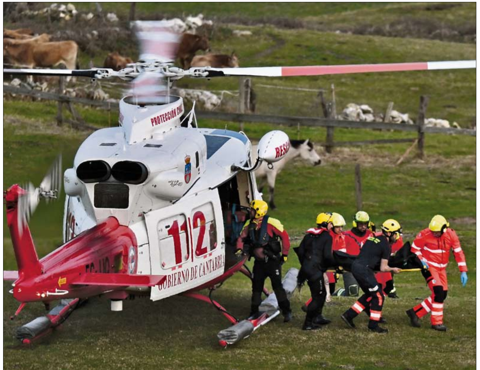
Los Servicios de Emergencias descenden uno de los cuerpos recuperados del mar.

La investigación judicial ha puesto el foco en una llamada realizada el día anterior al accidente. Según se ha conocido, un vecino de la zona se puso en contacto con el 112 para advertir del estado del puente y del riesgo que, a su juicio, podía suponer la infraestructura. Este aviso fue trasladado desde el servicio de emergencias