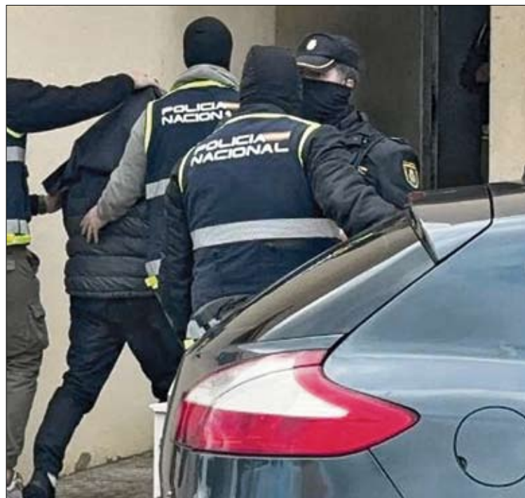
Detenido en Melilla un presunto yihadista.

2025 tuvo lugar el pasado 29 de enero, cuando la Policía Nacional detuvo a dos personas en la ciudad autónoma.