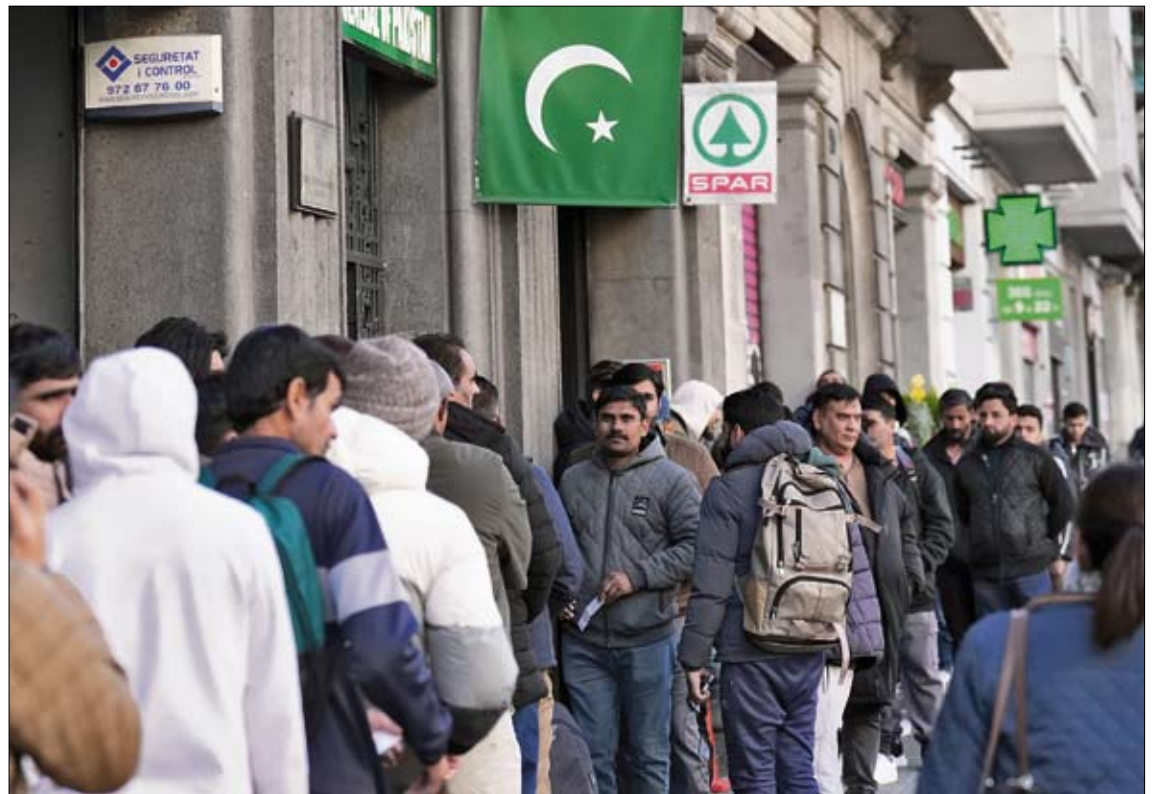
Largas colas para acogerse al nuevo proceso de regularización de migrantes, ante el Consulado de Pakistán en Barcelona.

La norma también introduce cambios en la acreditación de la residencia habitual en España. Aunque el