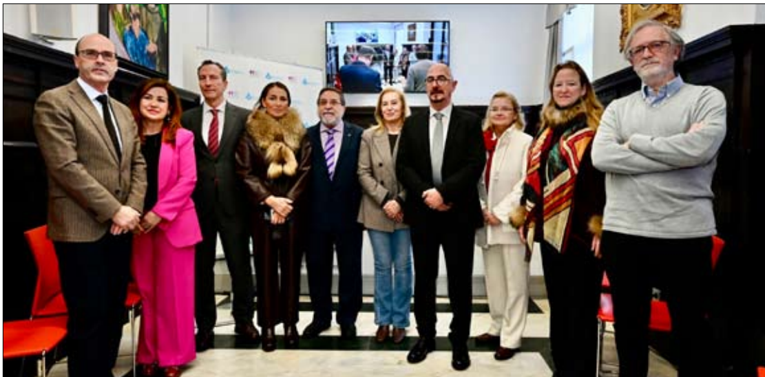
Santa Clotilde acogió los actos conmemorativos de la festividad de San Juan de Dios.

El análisis de los datos también revela diferencias en función del sexo de los profesionales. Las médicas sufren el 63,7 por ciento de las agresiones registradas, a pesar de representar el 54,8 por ciento del total de profesionales colegiados. En relación con esta situación, Rodríguez señaló que estos datos reflejan una tendencia que se mantiene en los últimos años y que apunta a un aumento de la brecha en la incidencia de las agresiones. Aunque el incremento de estos episodios afecta tanto a hombres como a mujeres, la OMC advierte de que el impacto es mayor entre las profesionales sanitarias. Este fenómeno se produce al mismo tiempo que aumenta el porcentaje de médicas dentro del conjunto de profesionales colegiados. El análisis por edades indica que el 29,9 por ciento de los médicos que sufrieron agresiones durante 2025 tenían menos de 35 años. A partir de los 56 años la incidencia desciende de forma notable, mientras que a partir de los 66 años los casos registrados son residuales. Sobre esta distribución por edades, Rodríguez explicó que «Los profesionales jóvenes y de mediana edad son los que sostienen el mayor porcentaje de actividad clínica, por lo que soportan la máxima carga de riesgo».