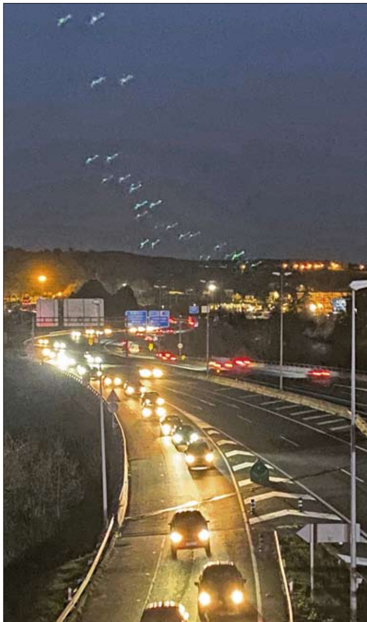
Atascos en la A-8 en la entrada a Torrelavega.

En relación con este punto, la Mesa de Movilidad recuerda que anteriormente presentó una alegación al proyecto en la que proponía la habilitación de un paso a nivel en ese mismo lugar. A su juicio, esta alternativa habría permitido mantener operativo el puente durante la mayor parte del día y reducir las consecuencias del corte para la movilidad en la zona.