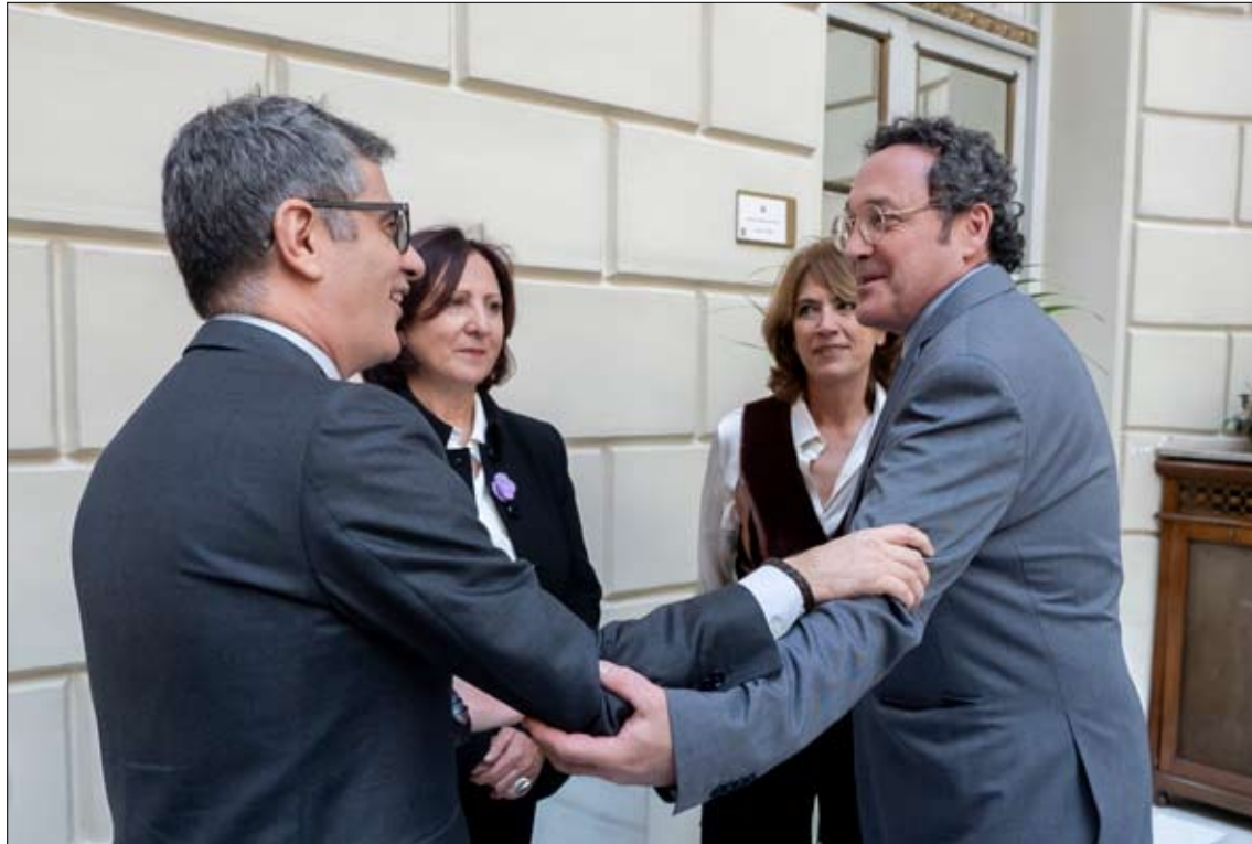
El ministro de la Presidencia, Félix Bolaños (i), y el exfiscal general del Estado Álvaro García Ortiz (d) se saludan durante la toma posesión de Teresa Peramato como Fiscal General del Estado.

«Yo lo que he hecho es dictar un decreto designando a la teniente fiscal para la disposición de ese recurso», manifestó la jefa del Ministerio Público al referirse al procedimiento administrativo mediante el cual se autoriza formalmente la interposición del recurso de amparo