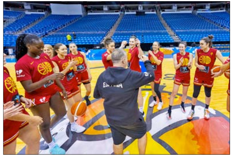
Las jugadoras de la selección femenina de baloncesto.