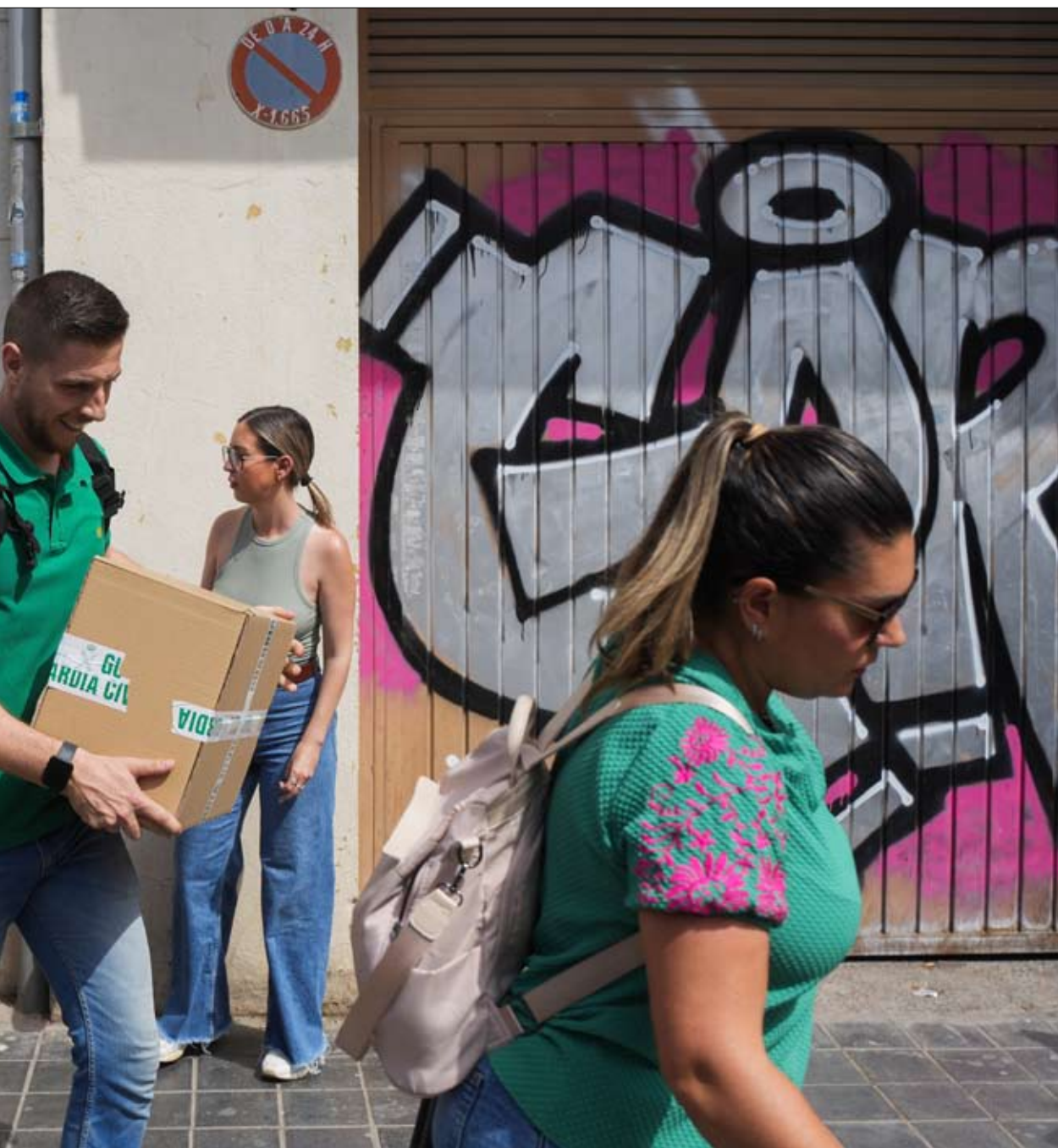
en junio de 2025.