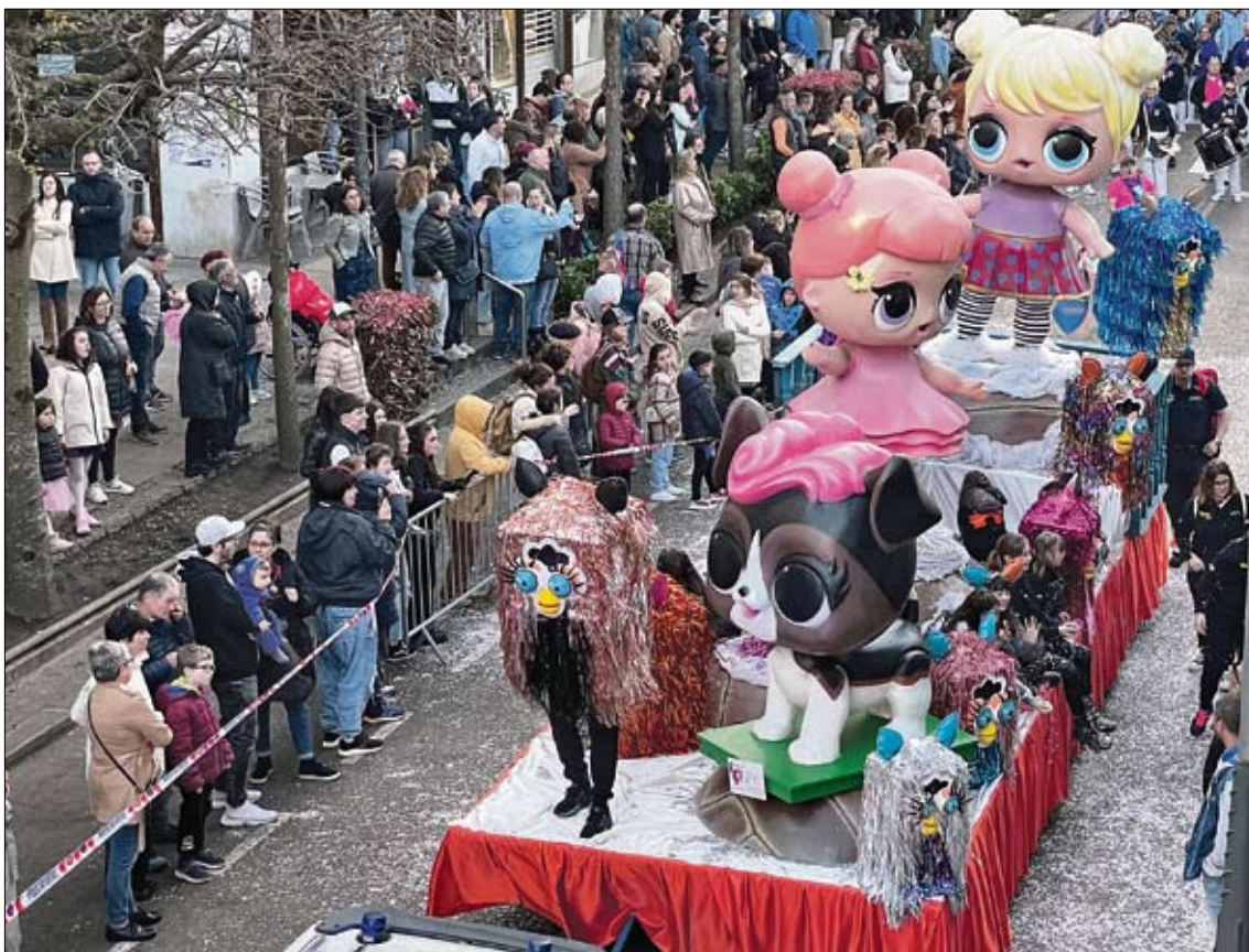
Charanga El Cancaneo y Coro Ronda El Midiaju participarán en la celebración festiva. / A.E.

histórica volvió a llenar las calles de ambiente y tradición, permitiendo a los asistentes revivir un momento clave de la historia de Noja y reforzar el vínculo con sus raíces.