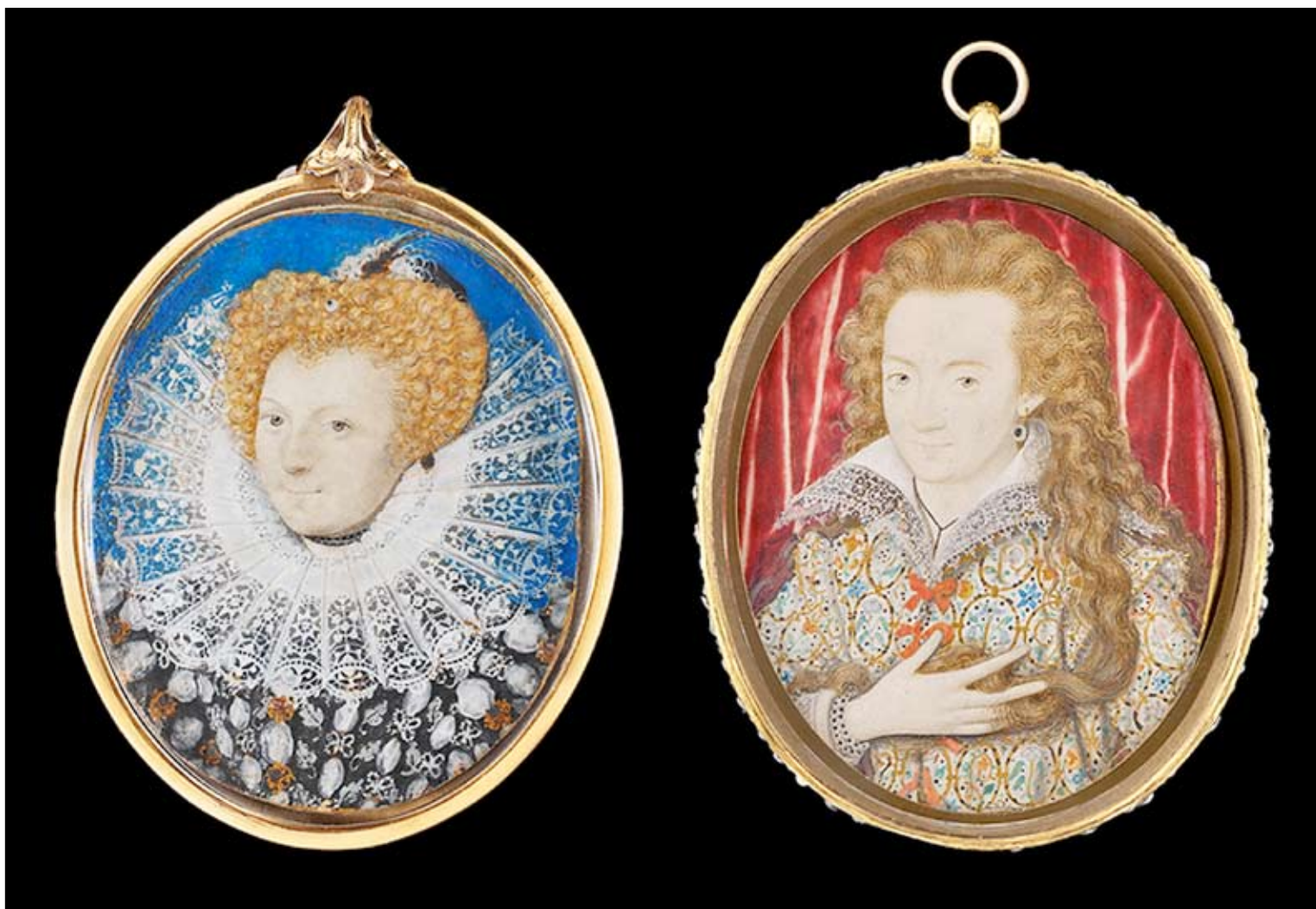
Se cree que estas miniaturas de retratos de Nicholas Hilliard, descubiertas recientemente, representan a Elizabeth Knollys, Lady Leighton y Henry Wriothesley, tercer conde de Southampton.

Número: 29.236 Año LXXXIV Depósito Legal SA-3-1959