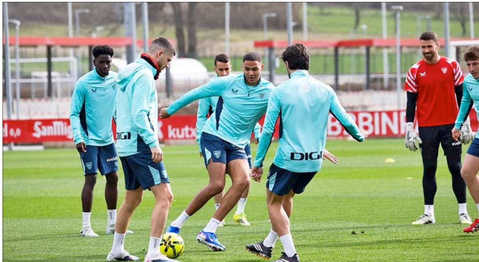
El Athletic Club durante unos entrenamientos en San Mamés.

Y además pensamos que todavía en España tenemos sedes que están fuera de la candidatura que tienen la posibilidad de que sean sedes en un futuro», explicó. Ante la posibilidad de que más ciudades se incorporen al catálogo definitivo de sedes para el Mundial 2030, Dervishaj reconoció que les «gustaría visitar todas las sedes posibles en España», pero el procedimiento establecido por FIFA hace que primero visiten «solo las sedes que están en la candidatura».