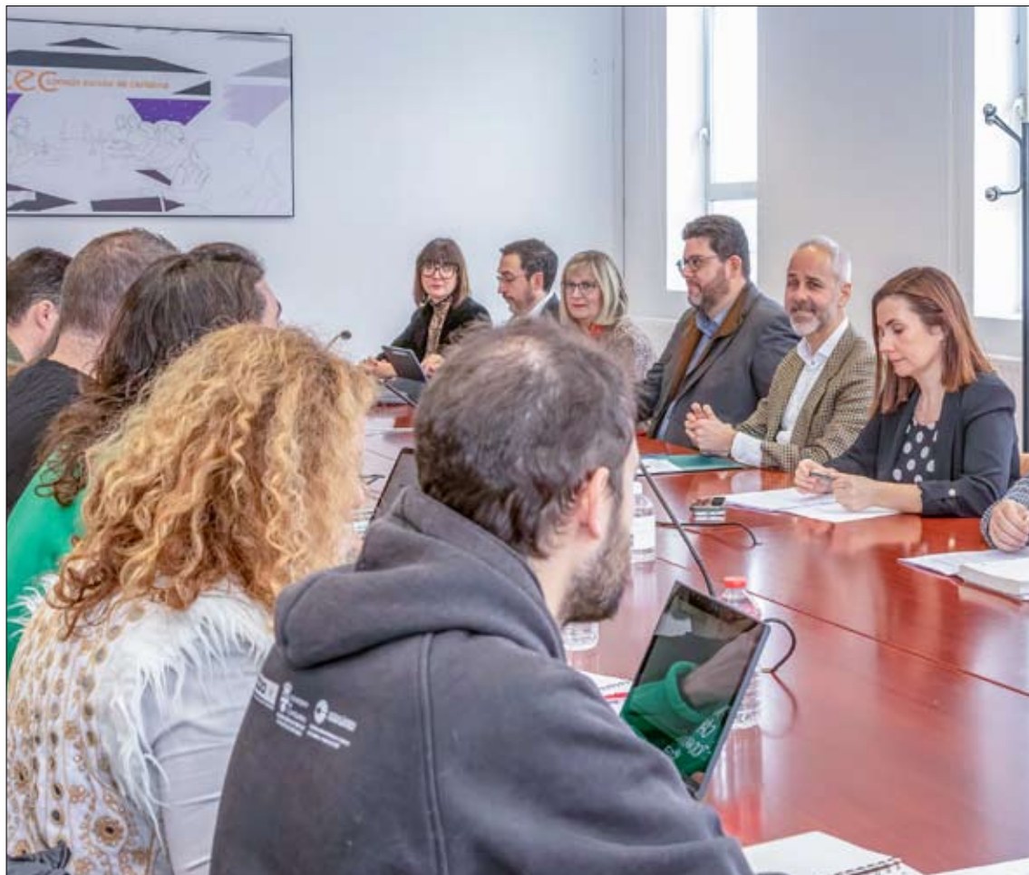
Encuentro de la mesa sectorial, que se volverá a reunir próximamente.

Mientras continúan las negociaciones, los sindicatos mantienen la convocatoria de la manifestación prevista para el sábado 14 en