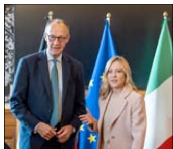
Friedrich Merz y Giorgia Meloni.

Los líderes de Alemania, Friedrich Merz, Italia, Giorgia Meloni, y Bélgica, Bart de Wever, han vuelto a convocar este martes a una reunión -esta vez telemática- a parte de sus socios en la Unión Europea para abordar la situación energética y el alza de los precios como consecuencia del conflicto en Oriente Próximo, así como formas de simplificación para impulsar la competitividad, en un encuentro que servirá para preparar el Consejo Europeo de la próxima semana. La reunión tuvo lugar ayer con