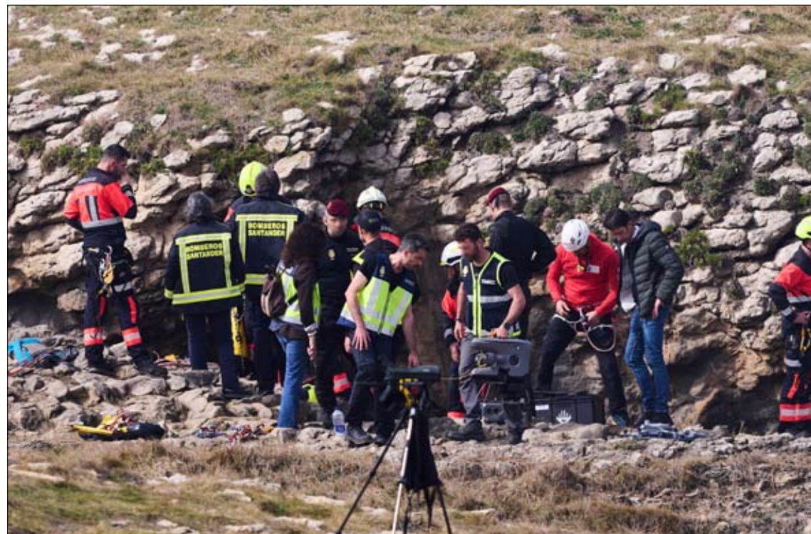
Labores de rescate en la zona de El Bocal tras el accidente.

Los trabajos de mantenimiento realizados en 2024 en la senda costera de Santander no detectaron fallos graves en la pasarela de El Bocal