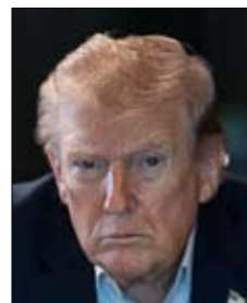
Donald Trump Presidente de EE.UU.

«Sería un tremendo error por parte de Israel invadir Líbano»