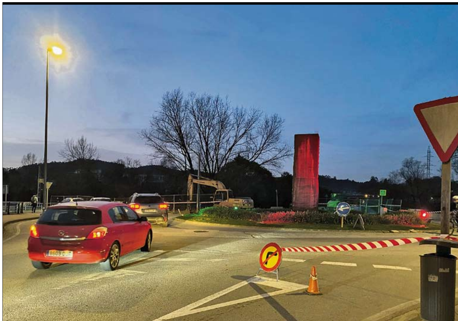
Los conductores deben circular por zonas en obras en Torrelavega. / ALERTA

La familia de una de las víctimas se persona en la causa por el colapso de la pasarela de El Bocal, que causó seis muertos | La jueza investiga avisos previos al 112 y pide documentación a administraciones P2-3