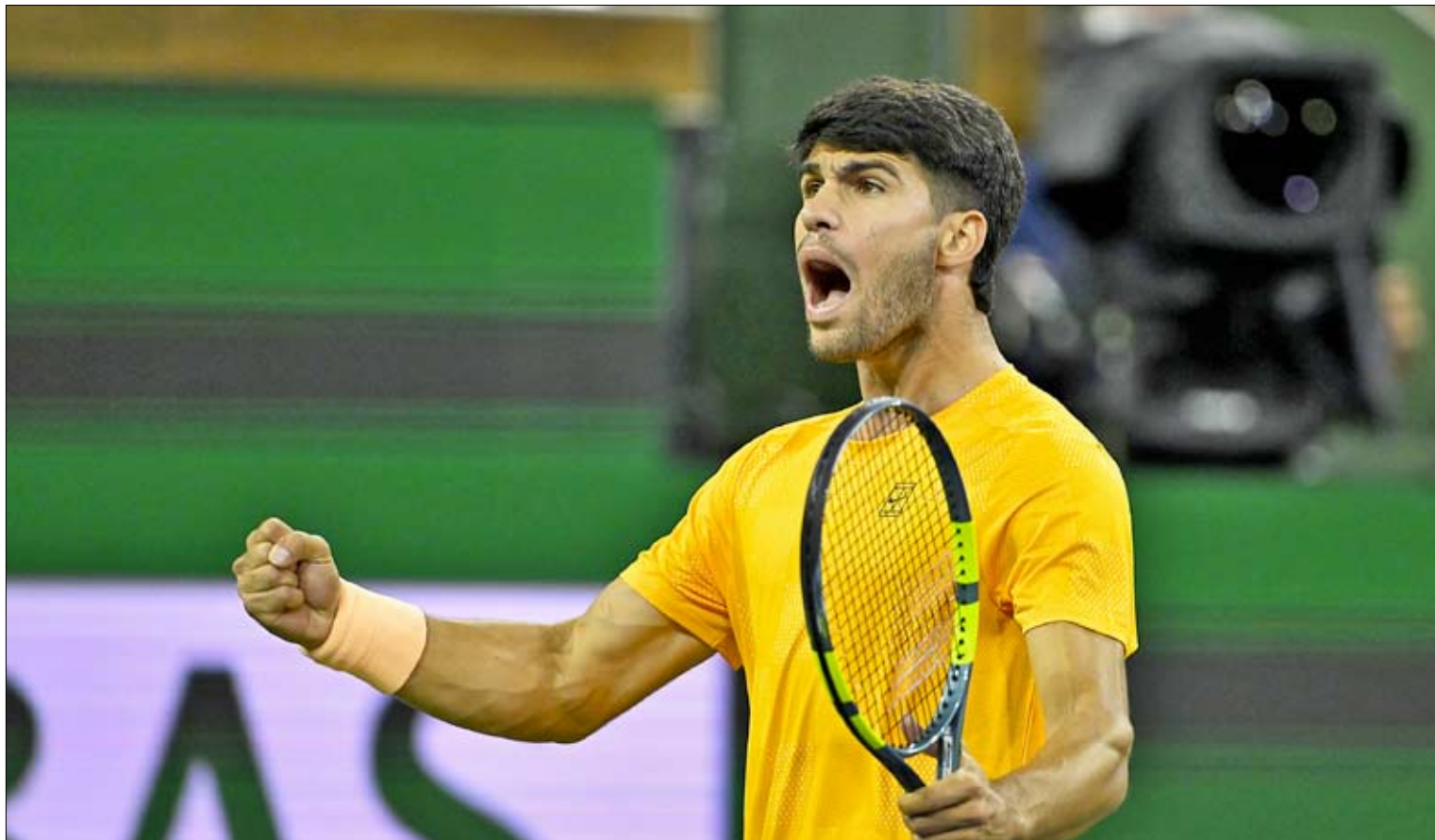
El tenista murciano Carlos Alcaraz celebra una victoria en el torneo de Indian Wells.

EL SEGUNDO CHOQUE DEL NÚMERO UNO DEL MUNDO EN EL DESIERTO CALIFORNIANO NO FUE NADA SENCILLO Y NECESITÓ CASI DOS HORAS Y MEDIA SUPERAR A UN RIVAL QUE JUGÓ A UN GRAN NIVEL TÁCTICO