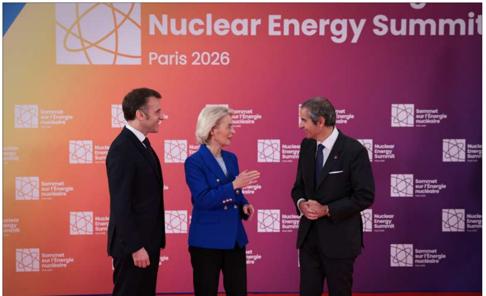
El presidente francés, Emmanuel Macron (izq.), y el director general del Organismo Internacional de Energía Atómica (OIEA), Rafael Grossi (der.), reciben a la presidenta de la Comisión Europea, Ursula von der Leyen.

CAMBIO DE RUMBO. Dentro de esa nueva hoja de ruta, Bruselas ha presentado una estrategia destinada a acelerar el desarrollo de los denominados reactores modulares pequeños, conocidos como SMR por sus siglas en inglés. Este tipo de