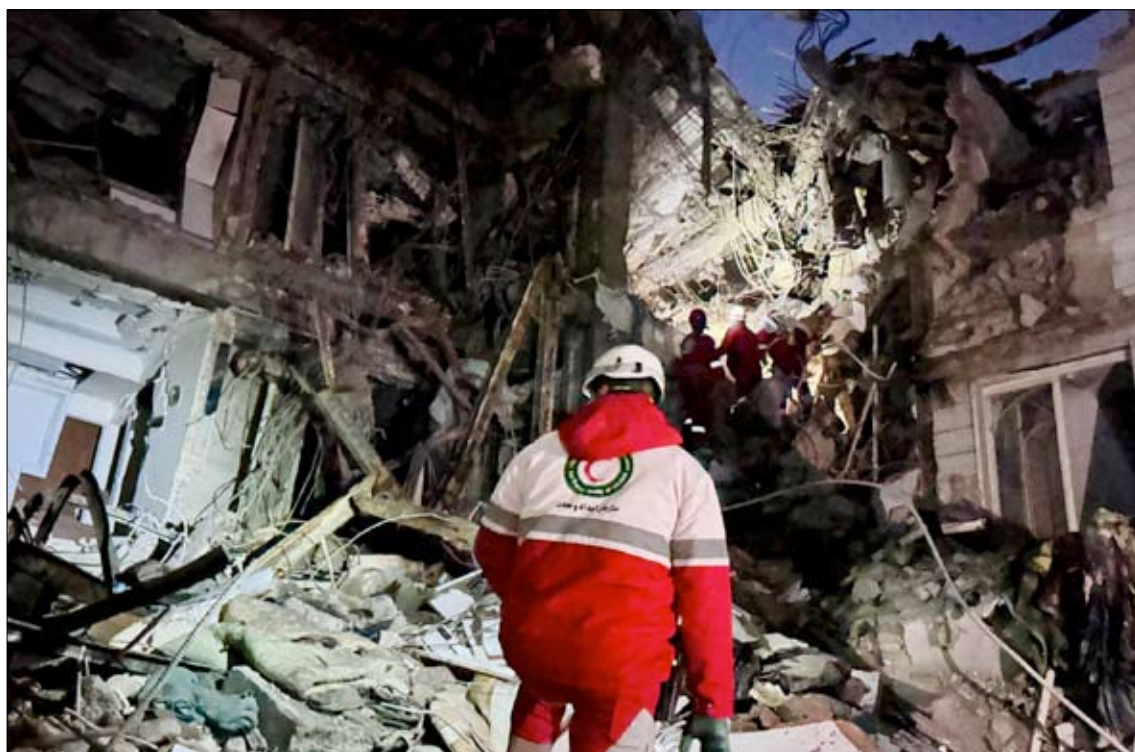
Miembros de los equipos de rescate de la Sociedad de la Media Luna Roja Iraní (MLRI) trabajan en el lugar de un edificio dañado en un ataque aéreo.

Fuentes del Ejecutivo de Von der Leyen no aclaran por el momento si formará parte esta vez de la cita telemática, mientras que desde el equipo del presidente del Consejo Europeo, António Costa, indican que el expresidente portugués ha sido informado, pero no participará en el encuentro.