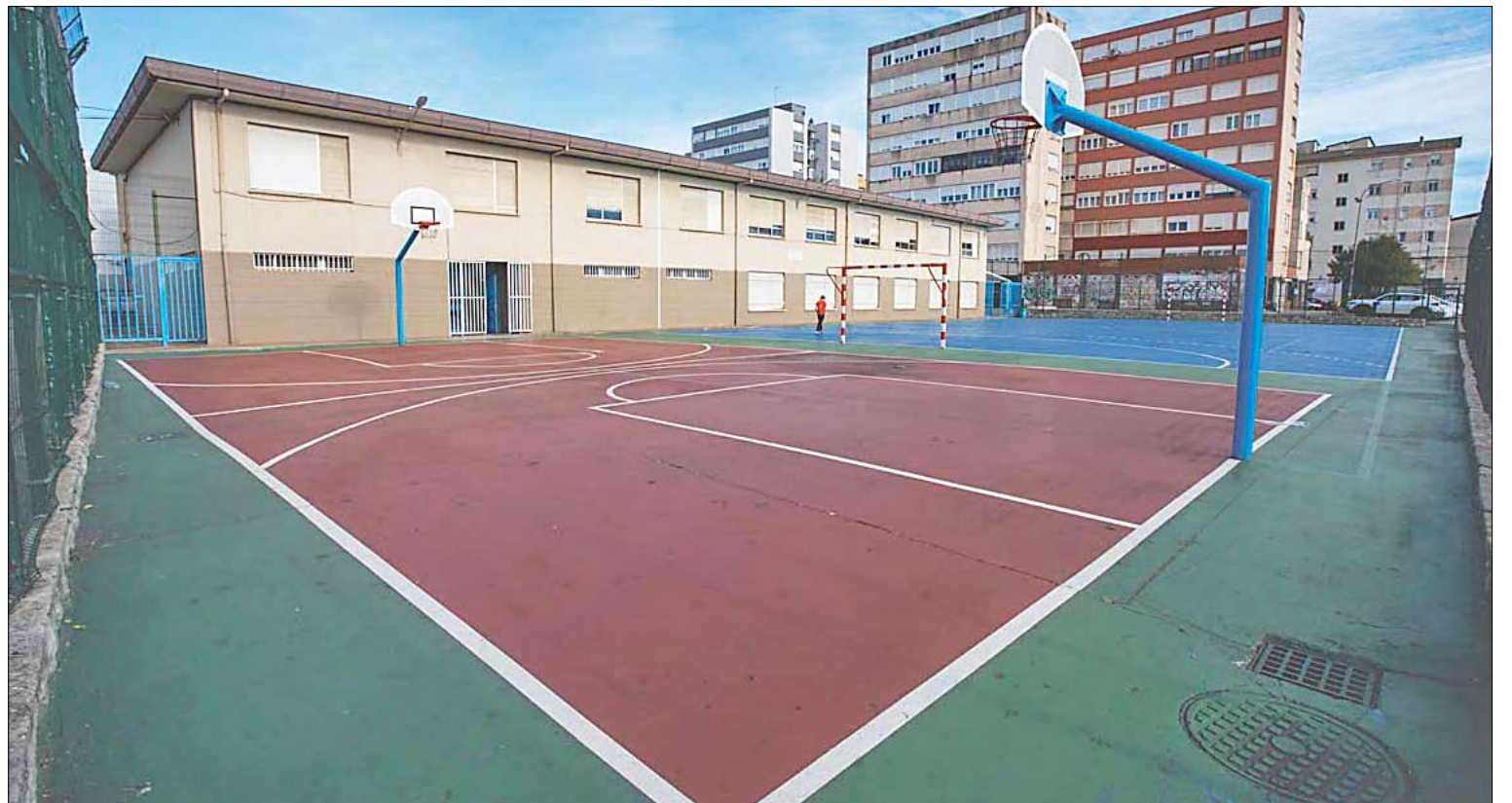
La intervención permitirá utilizar la pista durante todo el año, tanto en horario escolar como para jóvenes y vecinos fuera de clases.

'Pala' está considerado un referente del skate en Cantabria, incluso para las generaciones más jóvenes que comenzaron a practicar esta disciplina años después.