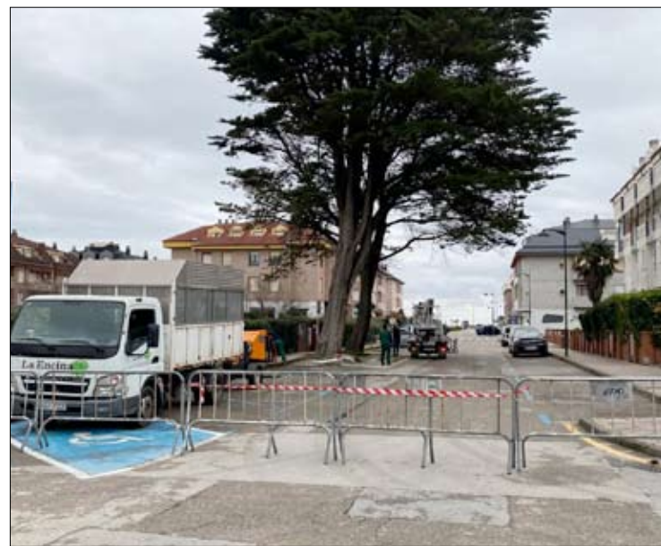
Uno de los ejemplares presenta clorosis generalizada y necrosis foliar.

Con estas actuaciones, Ribamontán al Mar refuerza su compromiso con la conservación de los espacios verdes y la seguridad de sus calles, asegurando que el patrimonio natural del municipio se mantenga en condiciones óptimas para disfrute de residentes y visitantes.