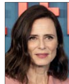
Aitana Sánchez-Gijón Actriz

«Si hubiéramos esperado tres días, creo que habríamos sido atacados»