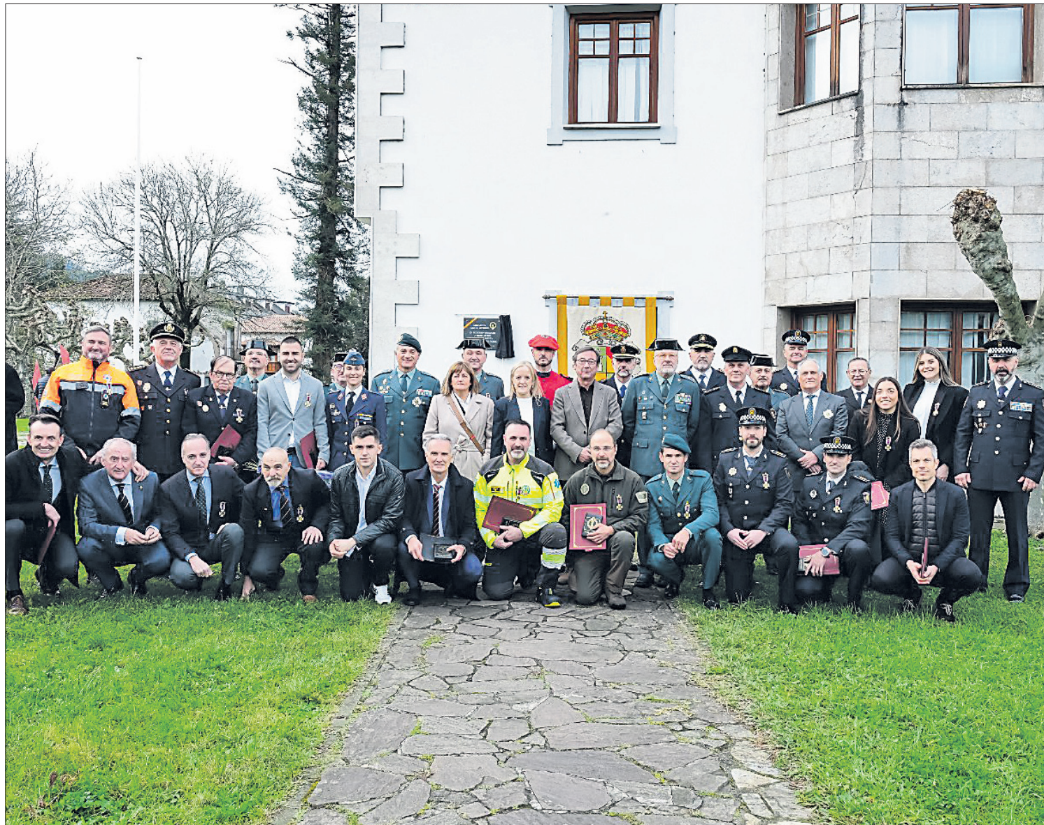
Homenaje a los miembros de los servicios de emergencias organizado por la Asociación 'Haz de Lictores'.

El homenaje ha reunido a cuerpos de seguridad, emergencias y víctimas del terrorismo en un acto solemne que ha reivindicado el valor humano del servicio público en Cantabria P2-3