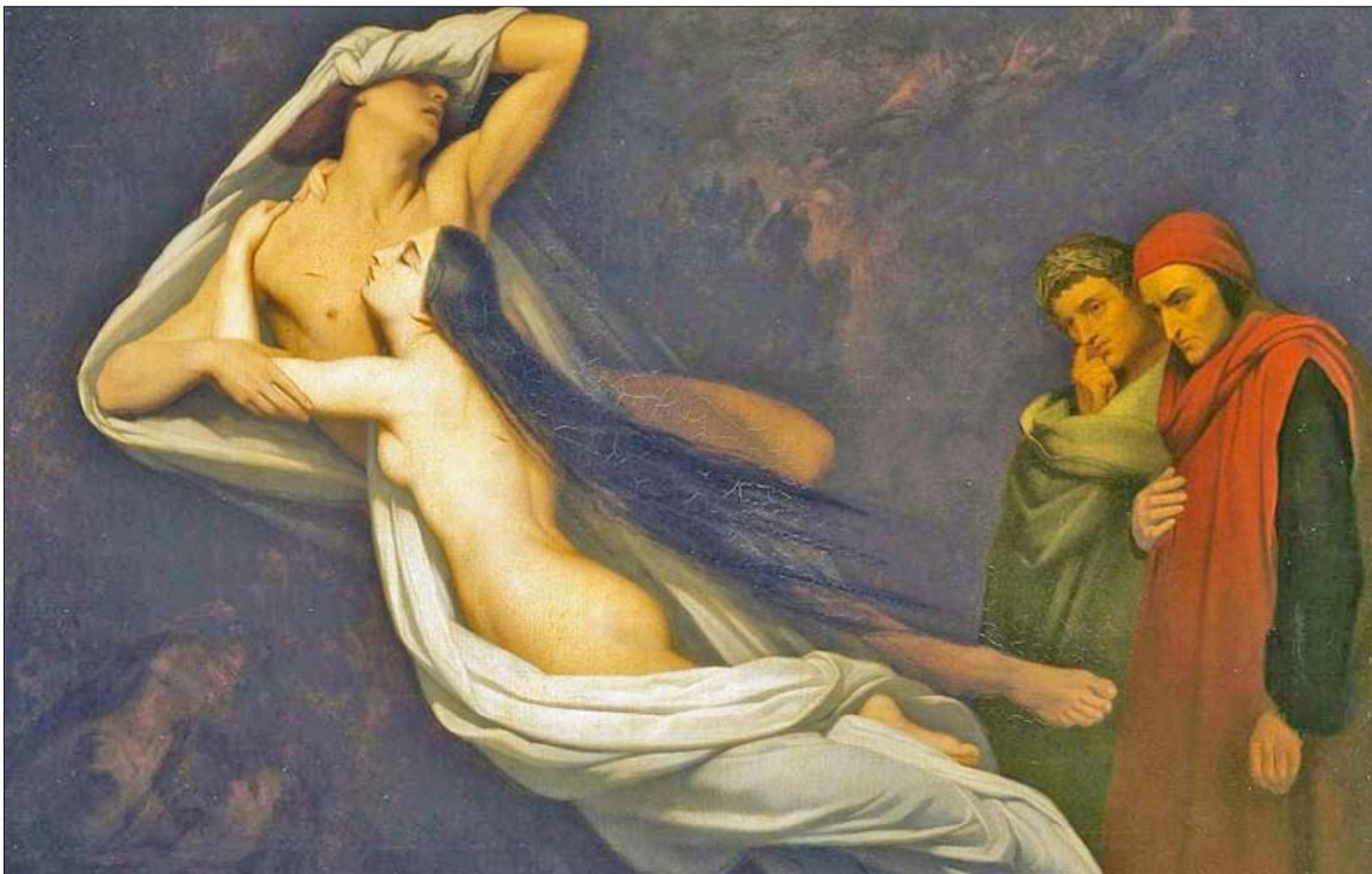
Ary Scheffer, Los fantasmas de Paolo y Francesca se aparecen a Dante y Virgilio, 1835./x