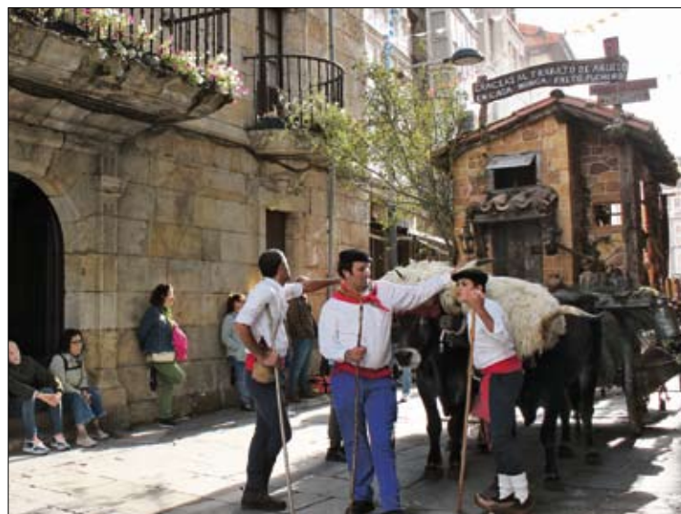
Vista de la carreta ganadora.

Tras la llegada de las carretas al punto final del recorrido, la plaza España se convirtió en escenario de una