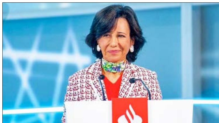
La presidenta del Banco Santander, Ana Botín.

Los clientes residentes en España podrán completar el proceso introduciendo su DNI o NIE español, junto con los datos de su tarjeta de crédito o débito, o bien el número