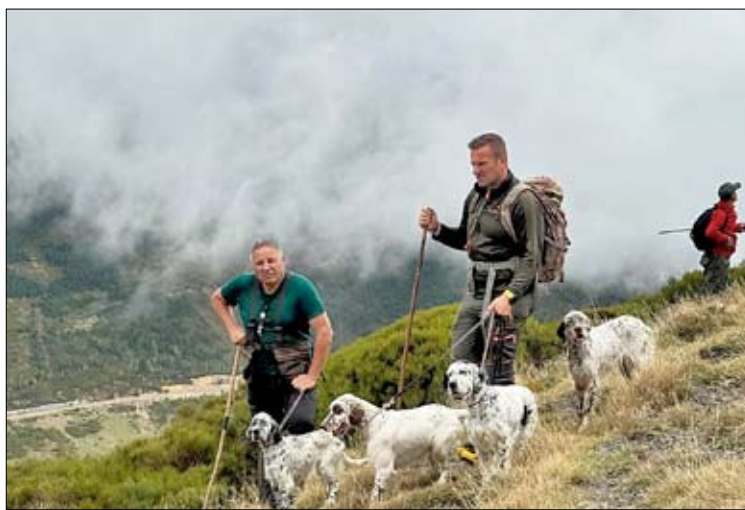
Varios cazadores con sus perros de muestra.