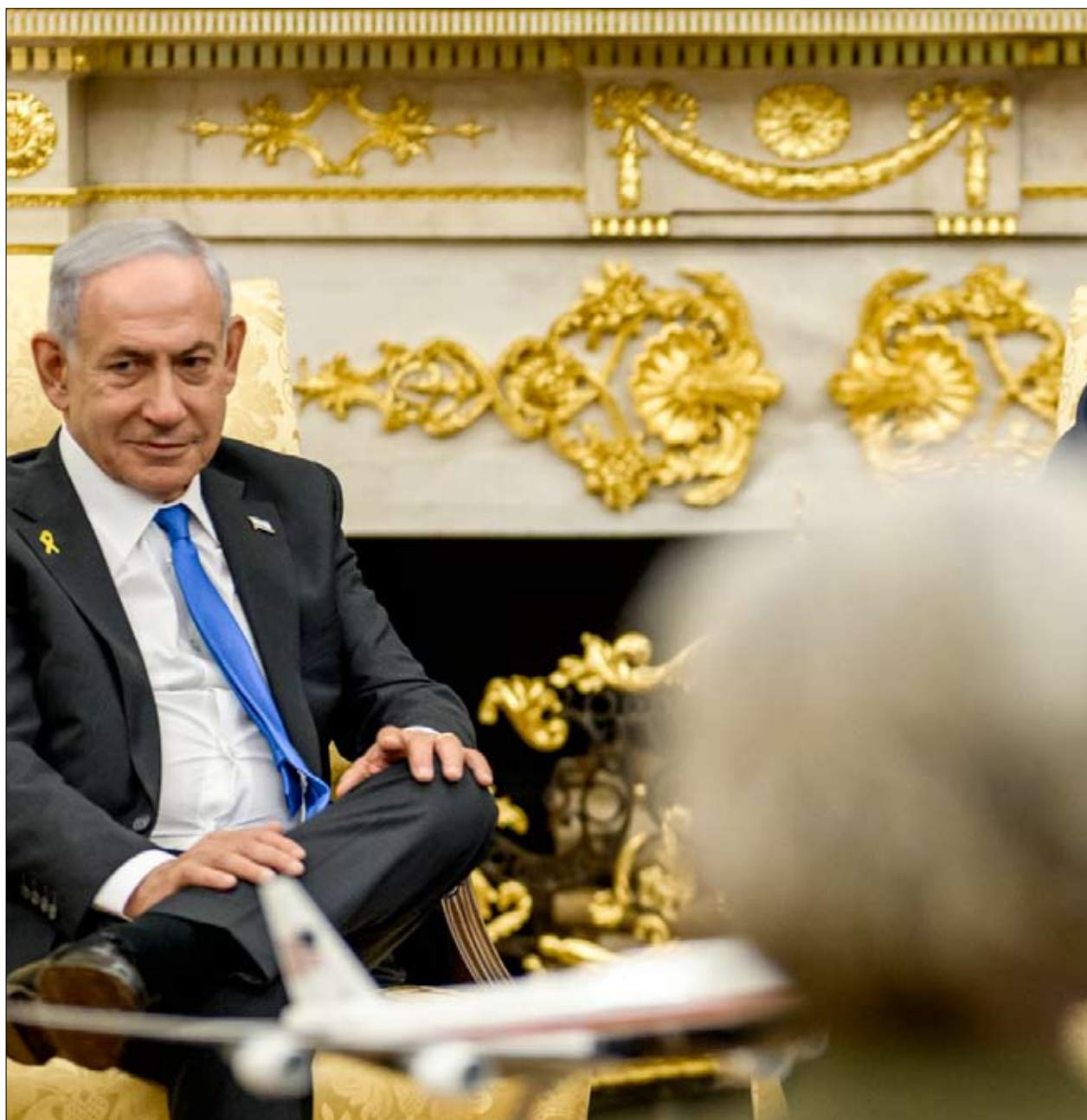
El presidente estadounidense, Donald Trump, junto al primer ministro israelí, Benjamín Netanyahu, mantienen una llamada con el príncipe saudita Mohammed bin Abdulrahman bin Jassim Al Thani en la Oficina Oval.

El documento arranca con una declaración que define la visión para el futuro de la Franja: «Gaza será una zona libre de terrorismo y desradicalizada que no representará una amenaza para sus vecinos» y será «reconstruida en beneficio de su población, que ya ha sufrido más que suficiente». Se establece que, si ambas partes aceptan la propuesta, la guerra finalizará inmediatamente