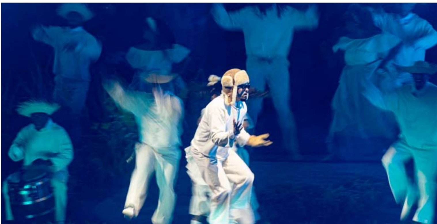
Bad Bunny actúa en uno de los espectáculos que ha realizado este verano . /x

La final de la liga de fútbol americano es el evento deportivo y televisivo más visto del planeta, y su show musical se ha convertido en una vitrina de prestigio que marca la cultura popular año tras año