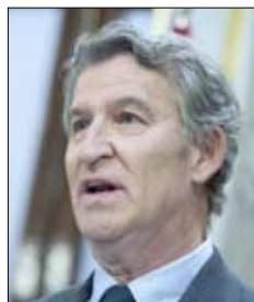
Alberto Núñez Feijóo Presidente del PP

«Ayudas como el IMV se deben ligar a la búsqueda activa de empleo»