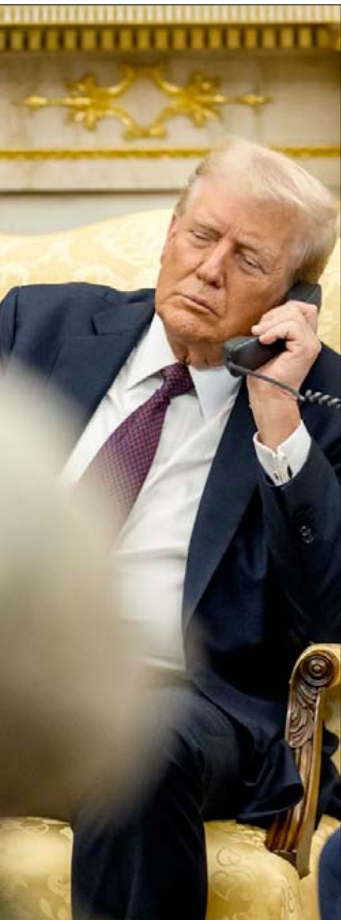
da telefónica con el primer ministro catari, Mo-

de la Paz», presidido por Donald J. Trump, con participación de otros líderes y expertos internacionales aún por anunciar, incluido el ex primer ministro británico Tony Blair. La Junta coordinará la financiación de la reconstrucción hasta que la Autoridad Palestina complete reformas estructurales que le permitan retomar el control de Gaza de forma estable. El plan también establece la creación de una Fuerza Internacional de Estabilización (FIS), integrada por socios árabes e internacionales, que se desplegará para apoyar a las fuerzas policiales palestinas y colaborar con Israel y Egipto en la seguridad de las fronteras. Se busca garantizar que Gaza permanezca desmilitarizada y evitar el resurgimiento de grupos armados.