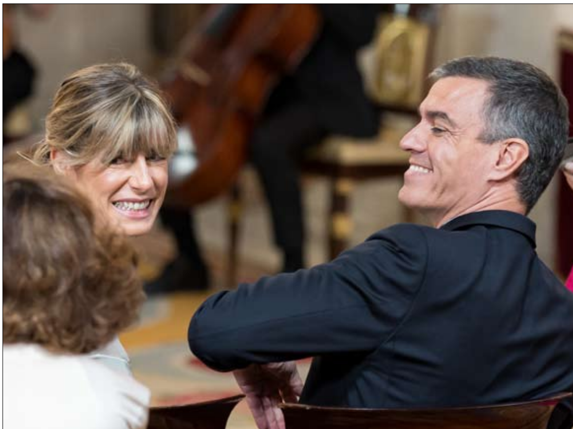
El presidente del Gobierno, Pedro Sánchez, y su mujer, Begoña Gómez.

La segunda irregularidad de mayor calado se encuentra en el sistema matemático empleado para calcular la puntuación de las ofertas. La IGAE concluye que la fórmula utilizada redujo artificialmente el peso del precio frente a los