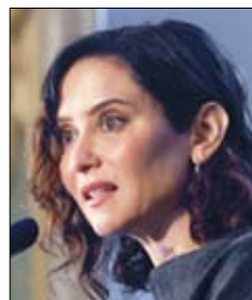
Isabel Díaz Ayuso Presidenta de la CAM

«Ayudas como el IMV se deben ligar a la búsqueda activa de empleo»