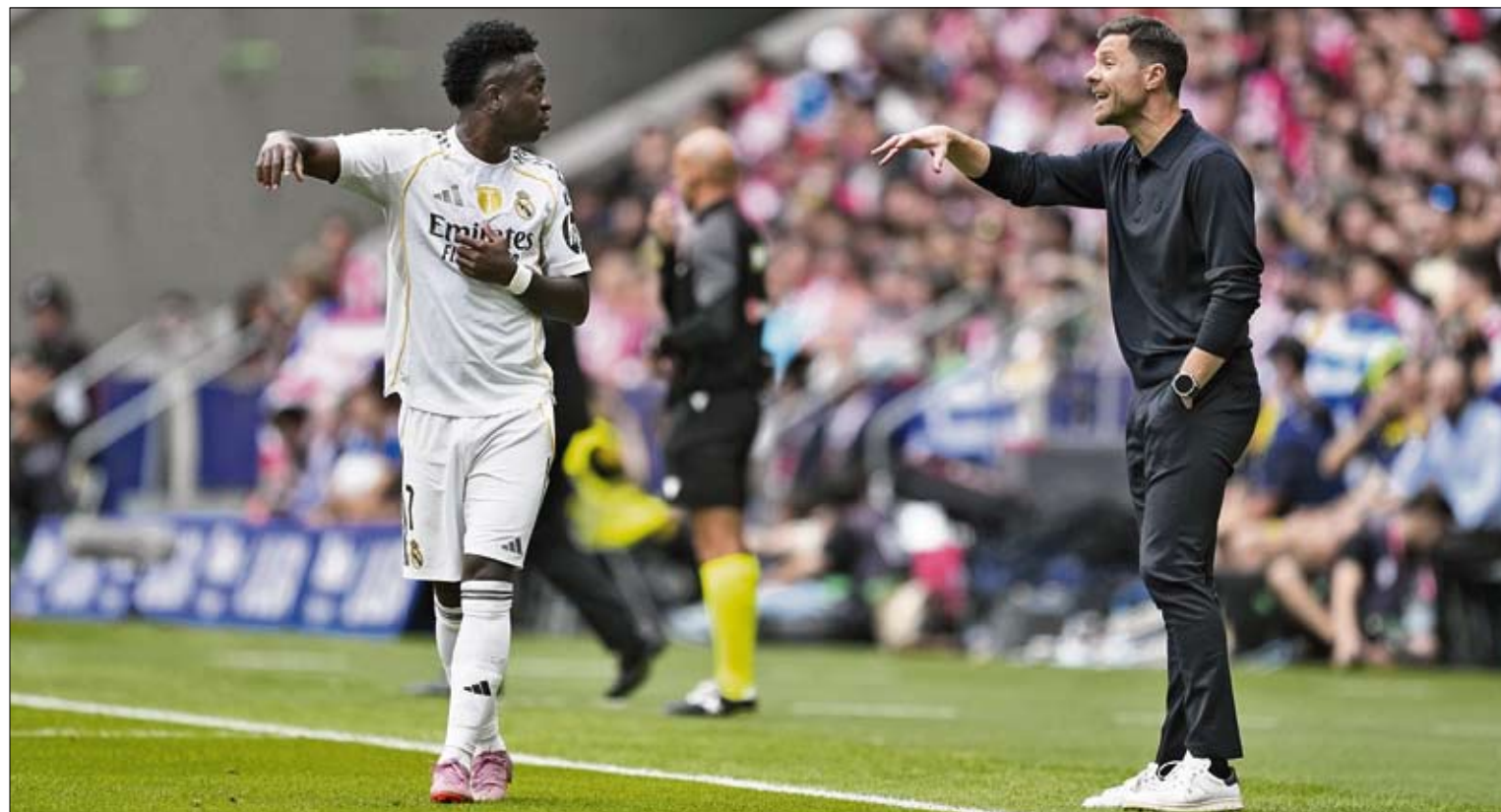
Xabi y Vinicius comentan una jugada durante el derbi liguero.

XABI ALONSO REIVINDICÓ LA IMPORTANCIA DE FIGURAS COMO BELLINGHAM, VALVERDE O ARDA GÜLER, DESTACANDO LA VARIEDAD DE RECURSOS EN LA PLANTILLA PARA REACCIONAR TRAS EL TROPIEZO LIGUERO