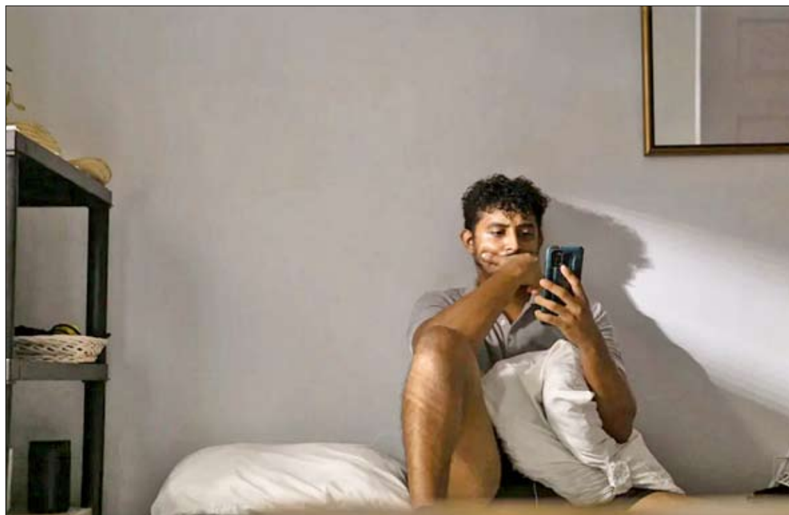
Varios estados de EE.UU. están comenzando a restringir las prácticas terapéuticas con IA.

Illinois sigue así a Nevada y Utah, pioneros en aprobar límites similares, mientras que California, Pensilvania y Nueva Jersey preparan sus propias iniciativas. En Texas,