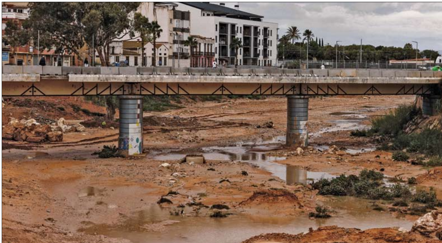
El barranco del Poyo a su paso por Paiporta, a 29 de septiembre de 2025, en Paiporta, Valencia.