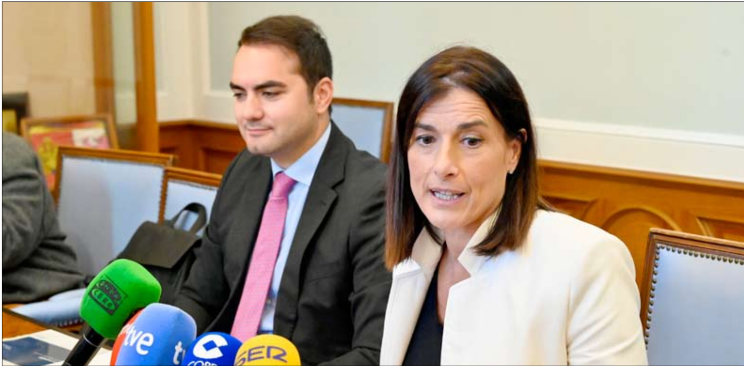
La alcaldesa de Santander, Gema Igual, ayer, durante la rueda de prensa.

Además, el Ayuntamiento organizará sesiones informativas en centros cívicos y una campaña de comunicación para explicar la normativa y los procedimientos asociados a la nueva tasa de residuos y a las modificaciones previstas en las ordenanzas. Con estas actuaciones, el Consistorio busca facilitar la comprobación de datos, detallar plazos y resolver dudas sobre los importes estimados en cada supuesto.