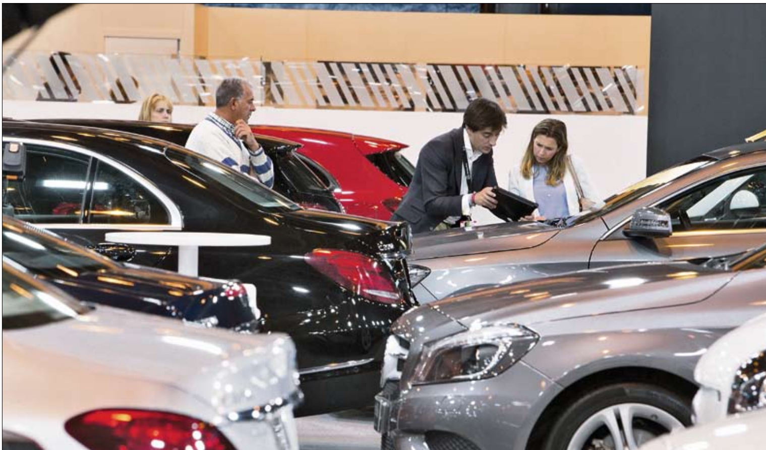
Varias personas mirando coches en una feria de vehículos de ocasión.