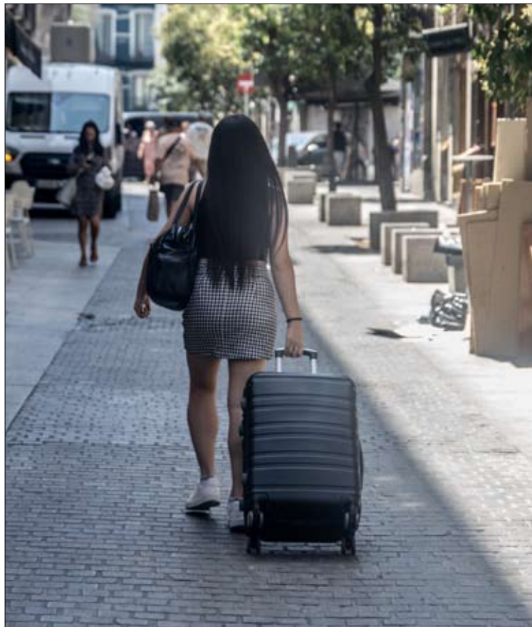
Una turista camina por una calle con su equipaje.

La organización sostiene que el carácter retroactivo del decreto es «ilegal» y que supondría «un grave perjuicio» para quienes poseen