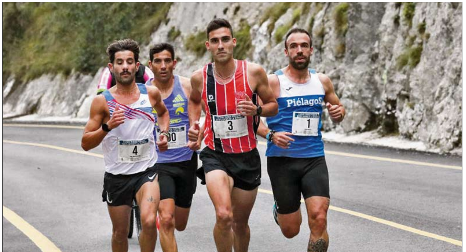
Varios participantes durante la carrera.

Desde la Federación Cántabra de Automovilismo (FCTA) se ha reconocido también el esfuerzo de la organización por intentar sacar adelante la prueba a pesar de las dificultades, destacando el trabajo realizado en los últimos meses para mantener vivo un evento que forma parte del patrimonio deportivo de la región.