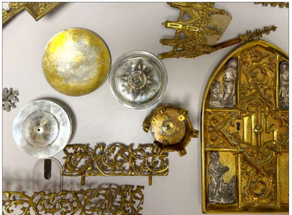
Los objetos recuperados por los agentes de la Guardia Civil.

A partir de la identificación del coche, los investigadores consiguieron establecer la identidad del sospechoso. Las indagaciones