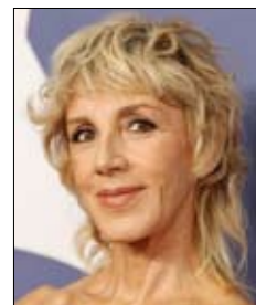
Ana Torroja Cantante

«Trump ha autorizado a Ucrania a realizar ataques de largo alcance contra Rusia»