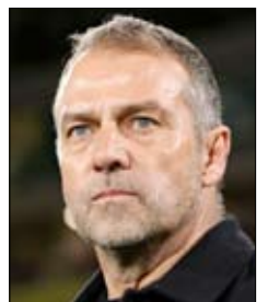
Hansi Flick Técnico del FC Barcelona

«Yo no tomaba drogas, pero me afectaban porque mis amigos sí»