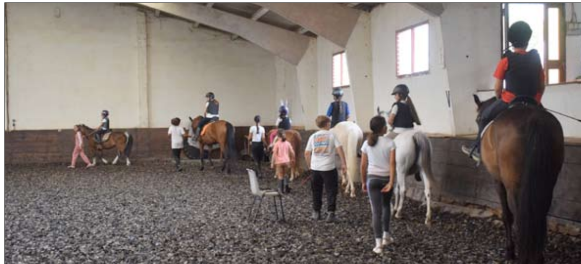
Algunos de los niños realizando una de las actividades.

La programación estival del municipio, desarrollada durante los meses de julio y agosto, incluyó ocho cursos y cinco campus especializados