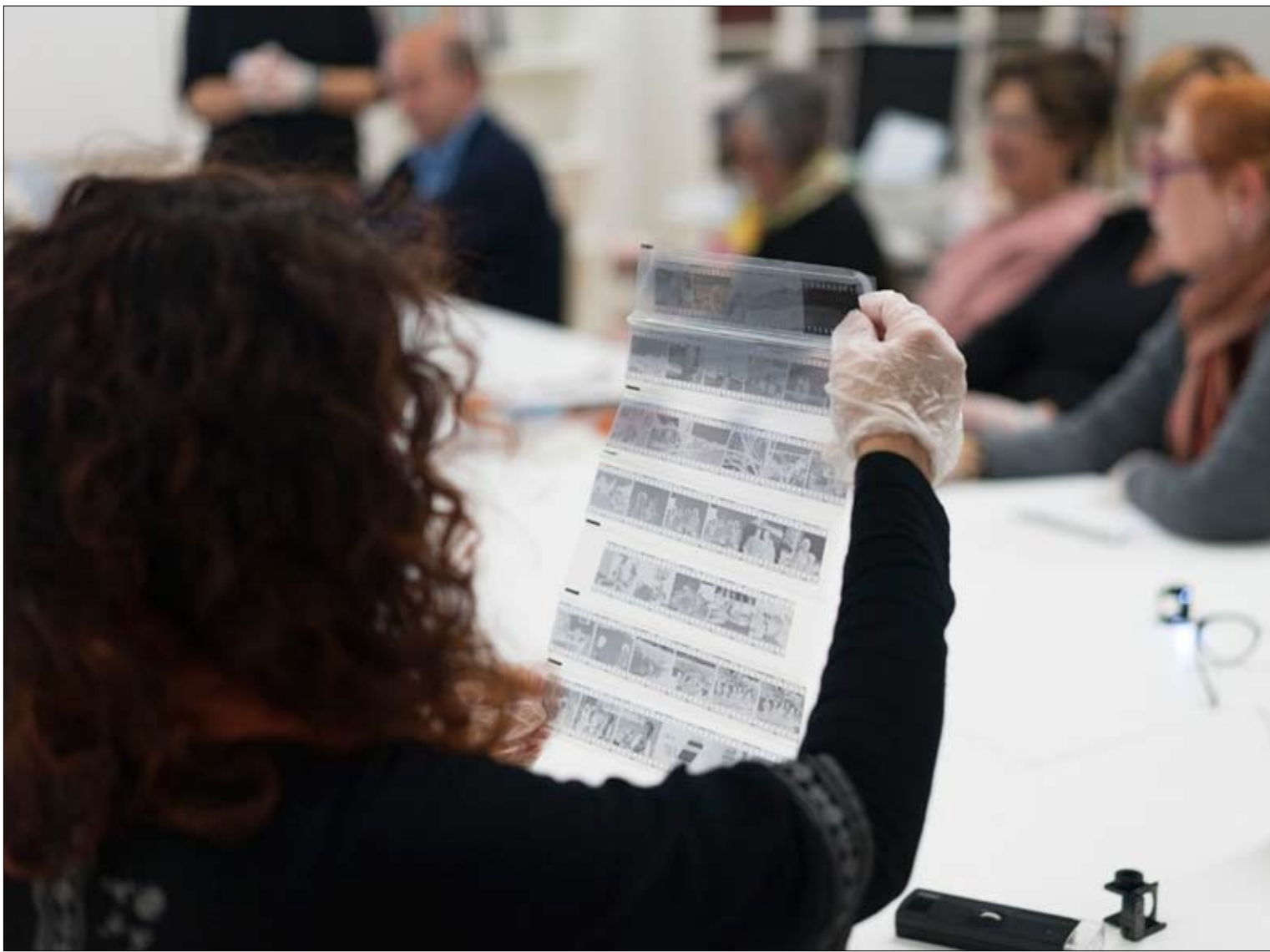
Taller de recuperación del patrimonio fotográfico que se celebra en la Casona de Tudanca. / X