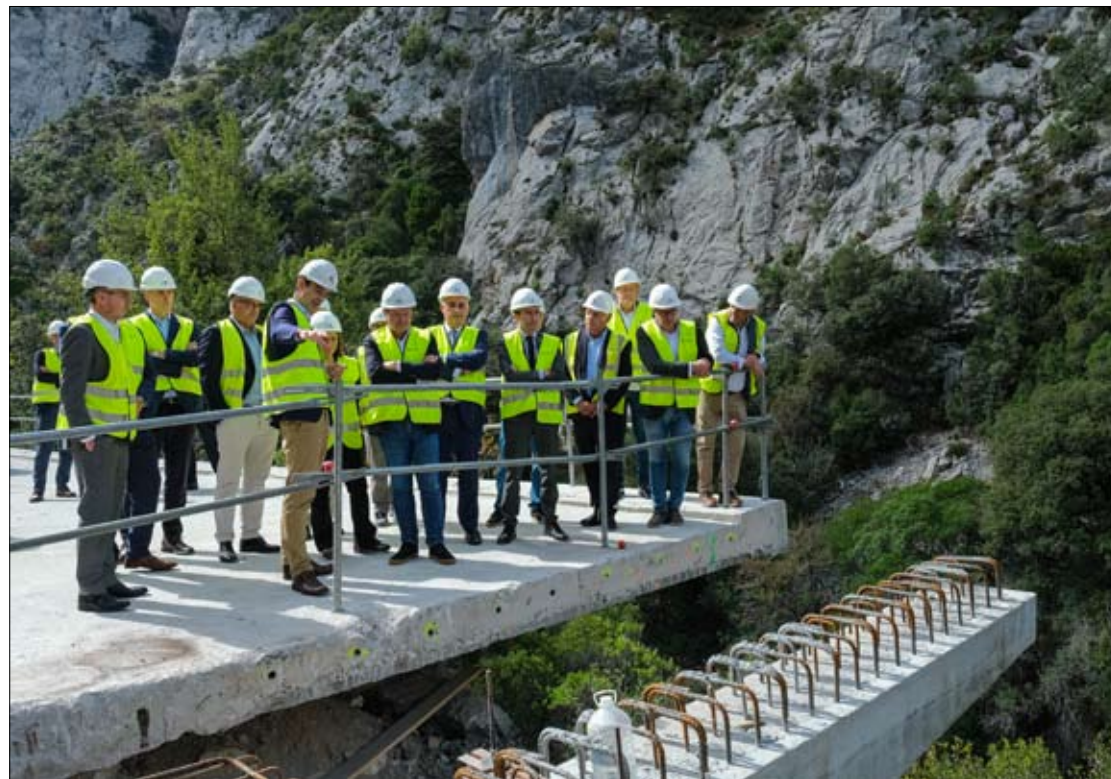
Las autoridades, ayer, en la visita a las obras del Desfiladero de la Hermida.

Las obras de la N-621 avanzan con un 76% ejecutado y una inversión cercana a 114 millones desde 2018 | El proyecto moderniza la vía, mejora seguridad, accesibilidad y reduce tiempos de viaje entre Cantabria y Asturias