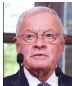
Keith Kellogg Enviado de EE.UU. a Ucrania

«Es una tarea de la justicia decidir si hay genocidio en Gaza»