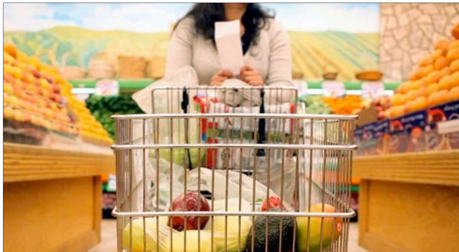
Una persona hace la compra en un supermercado gallego / x

El INE tiene previsto publicar los datos definitivos del IPC correspondiente a septiembre el próximo 15 de octubre, que confirmarán o ajustarán estas estimaciones preliminares.