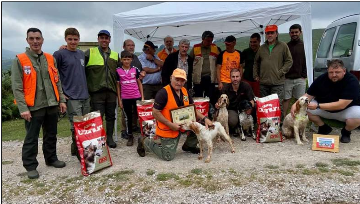
Campeonato Regional Perros Muestra en una edición anterior. / SAJA