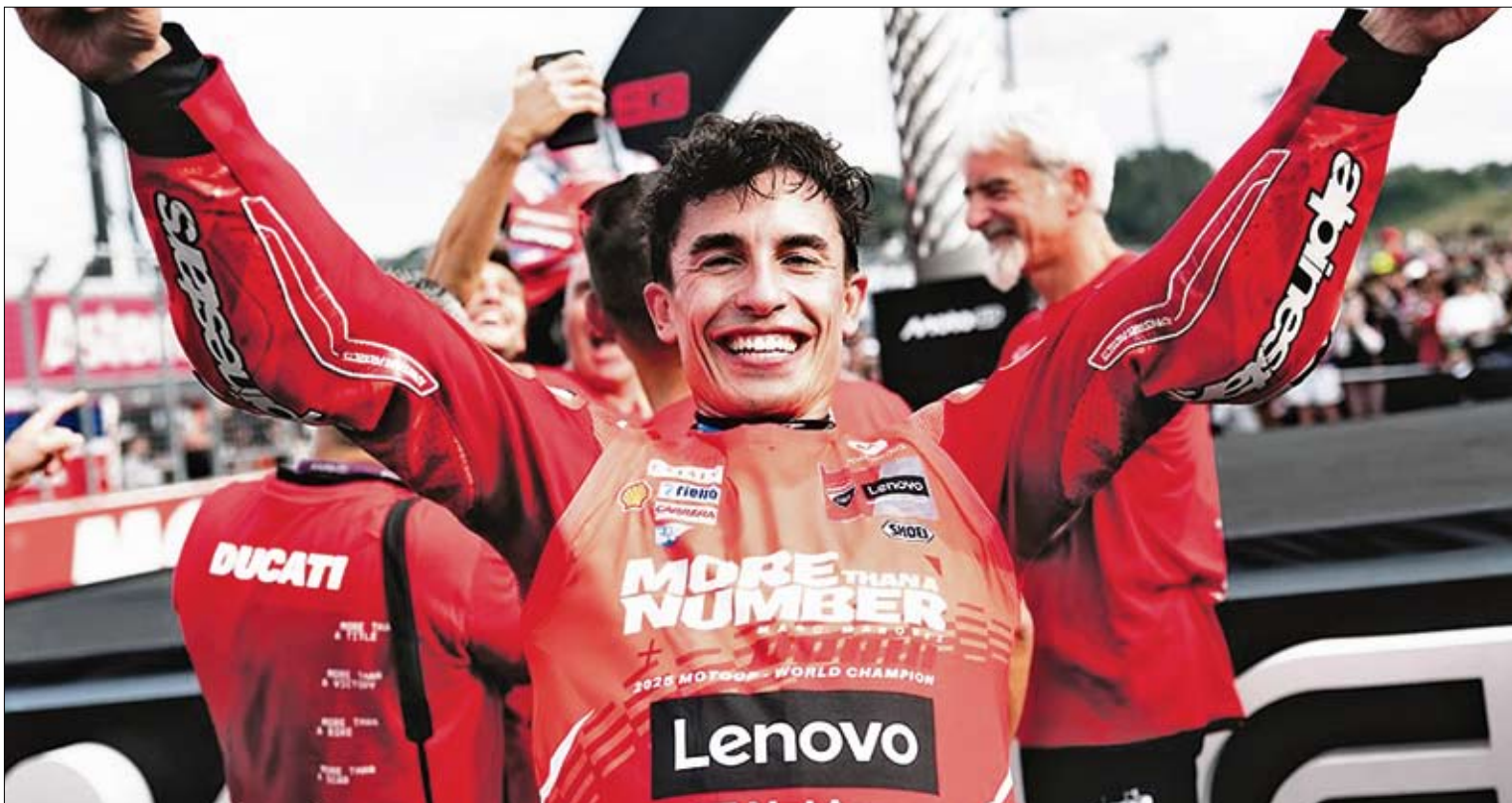
Marc Márquez celebra su título mundial.

y definitivo set el que dictaría sentencia en un partido muy igualado que se estaba decidiendo por pequeños detalles. En la tercera manga, ambos ganarían cómodamente sus servicios hasta el cuarto juego. Ahí, Alcaraz cometió varios errores no forzados, uno en forma de doble falta, que le dieron dos pelotas de rotura a Ruud. Pero una derecha cruzada y un buen segundo saque salvaron al murciano, que pudo mantener el saque (2-2). Una inercia positiva que utilizaría en el siguiente juego para asestar el golpe definitivo al partido en forma de rotura, primero, y consolidando el 'break', después. Y tras mantener también sus dos siguientes juegos al saque, el de El Palmar acabó cerrando el partido por 6-4. Ahora, en la final, tendrá que superar al estadounidense Taylor Fritz.