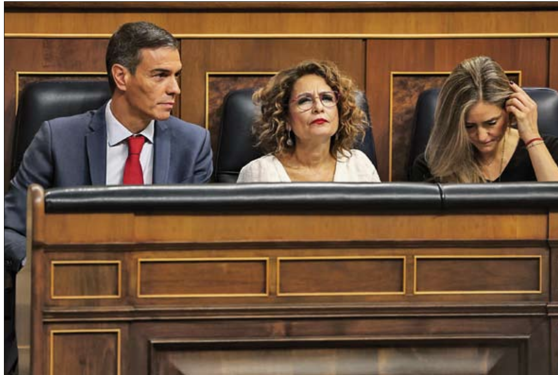
(I-D) Pedro Sánchez, María Jesús Montero y Sara Aagesen.

Históricamente, gobiernos de todos los colores han presentado cuentas fuera de plazo, pero el triplete consecutivo del sanchismo marca un récord negativo. La situación provoca inseguridad jurídica, complica la negociación con los socios parlamentarios y transmite