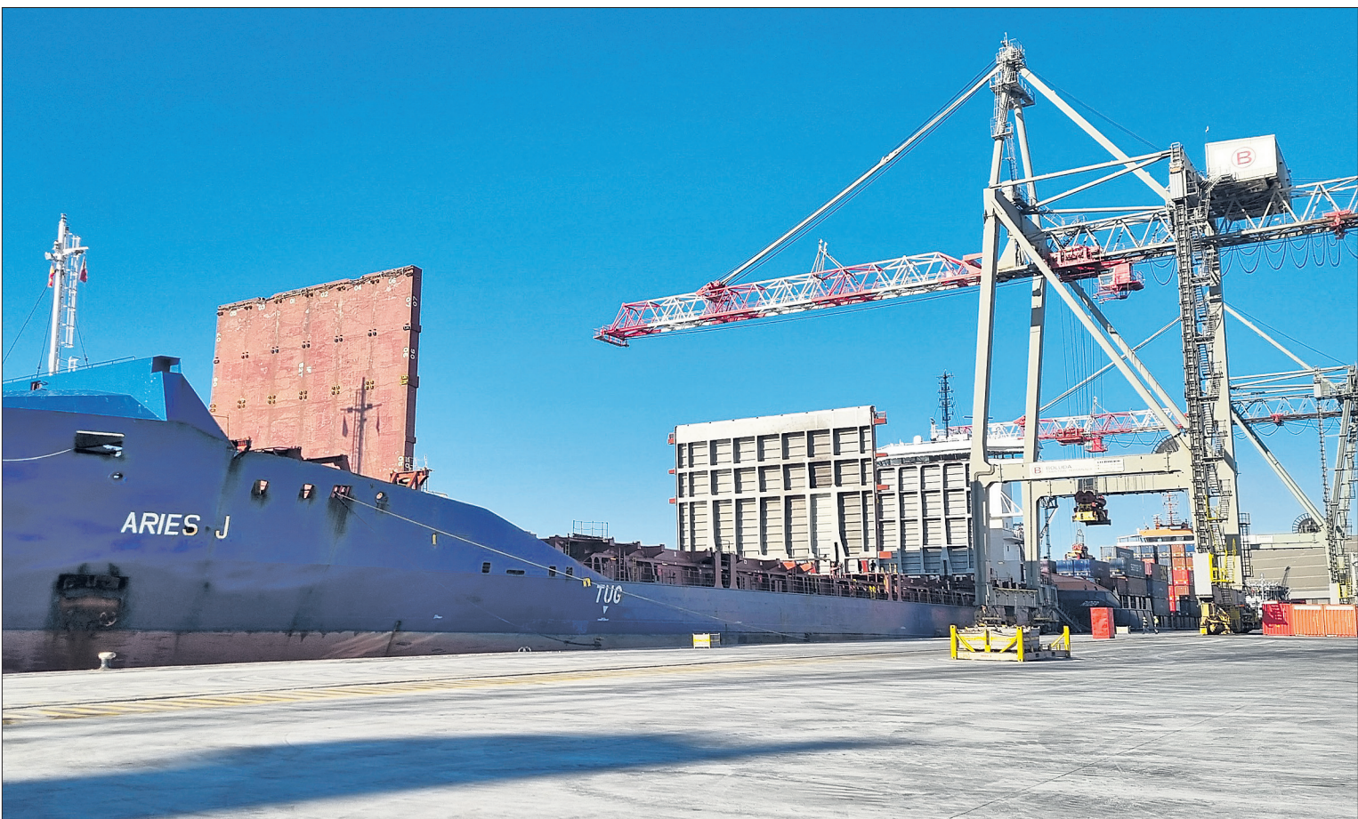
El Puerto de Santander podrá operar dos buques simultáneamente. / ALERTA

El próximo año estudiarán la autovía ferroviaria Valladolid-Santander P3