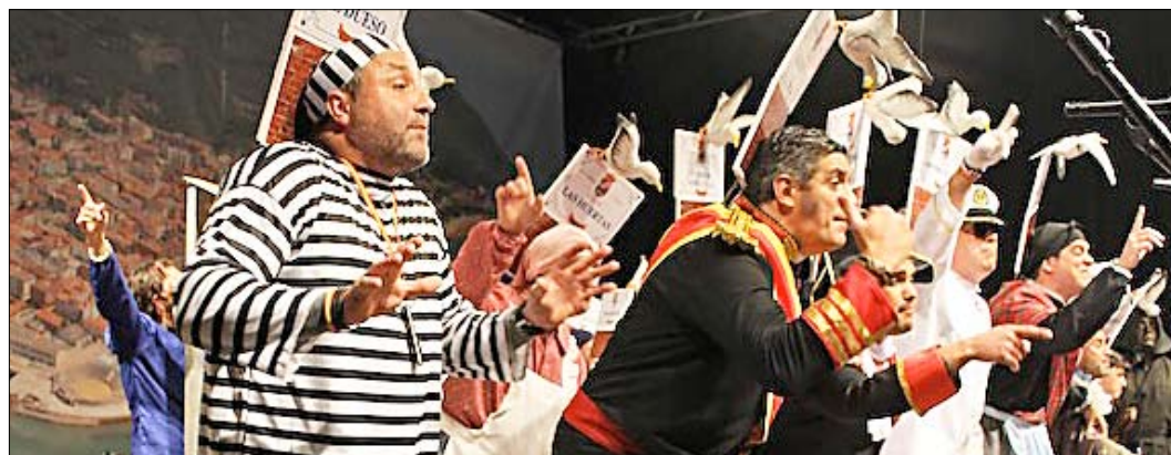
Santoña dio inicio a las murgas que se centraron en personas como Rubiales, Revilla o Ayuso.