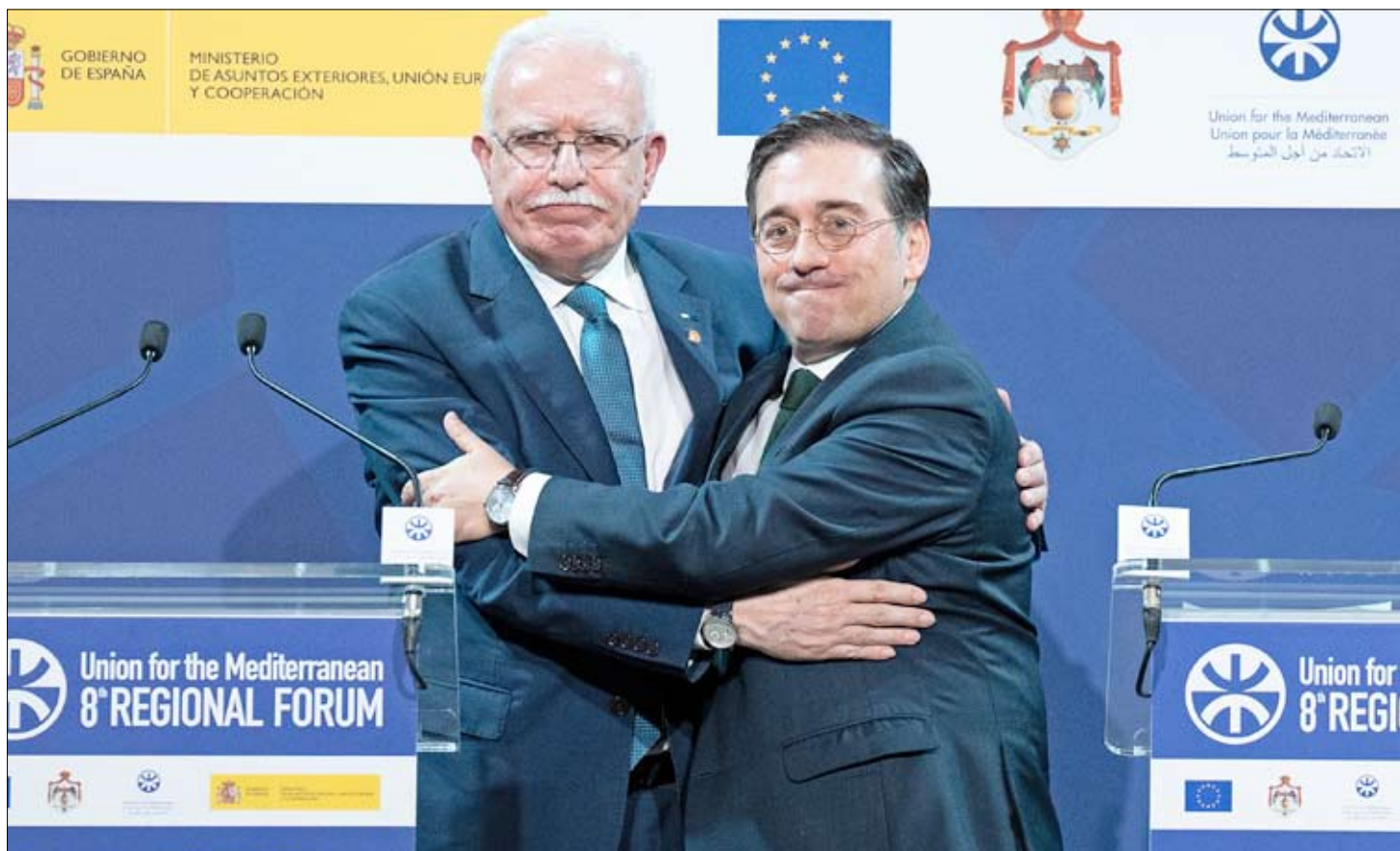
José Manuel Albares (d) abraza al ministro de Asuntos Exteriores de la Autoridad Nacional Palestina, Riyad Al-Maliki.

En medio de crecientes tensiones diplomáticas, el Gobierno español se encuentra inmerso en una disputa con Israel. La controversia surgió después de que las autoridades hebreas acusaran a Sánchez de respaldar el «terrorismo» de Hamás durante su reciente visita a Jerusalén. El ministro de Asuntos Exteriores, José Manuel Albares, respondió a estas acusaciones durante la apertura del Foro Regional de la Unión por el Mediterráneo en Barcelona. P20