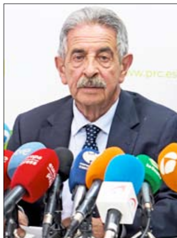
Miguel Ángel Revilla.

presidenta del PP cántabro dijo que «mañana sera el nuevo día de un nuevo futuro, los cántabros exigen un gobierno nuevo pero dicen que fuerzas políticas tenemos que llegar a un acuerdo». P2-3