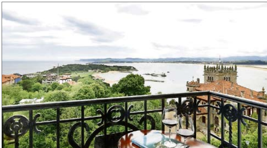
Vistas desde el Eurostars Hotel Real de Santander.