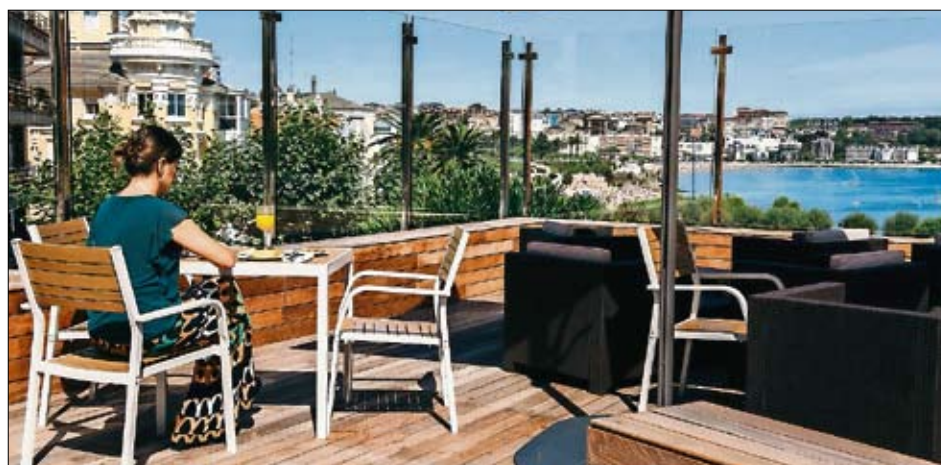
Terraza del Gran Hotel Victoria en Santander.