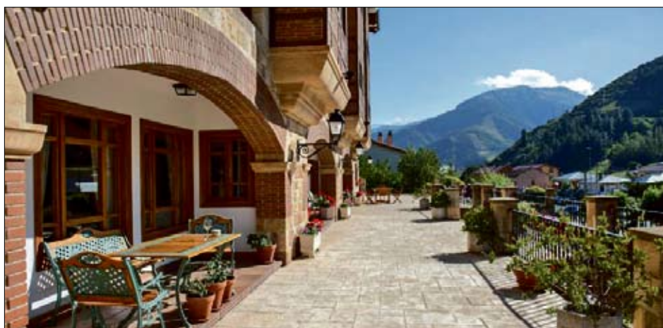
Exterior del restaurante del Hotel Infantado en Liébana.