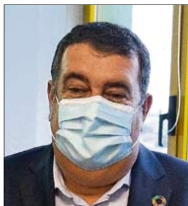
Ernesto Gasco, Alto Comisionado para la lucha contra la pobreza infantil del Gobierno central.

Vega de Pas, para poner en marcha un proyecto de recuperación de ese entorno que supondrá una inversión de 3,4 millones de euros. La región remitirá el proyecto al Estado para el plan de reconstrucción de la UE. Página 5