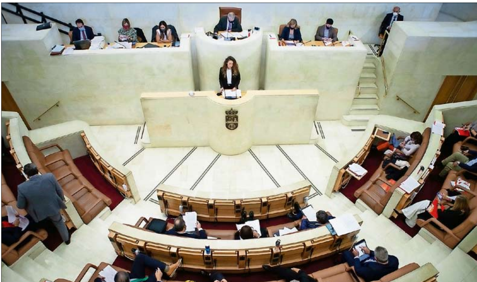
Un instante de la sesión plenaria de ayer en el Parlamento de Cantabria.

Las acciones de Libertbank llegaron a subir en el día de ayer hasta el 20% y las de Unicaja Banco, hasta el 15%, aunque al cierre de la sesión perdieron fuelle • El último intento de unión de ambas entidades tuvo lugar en mayo del año pasado / P. 24